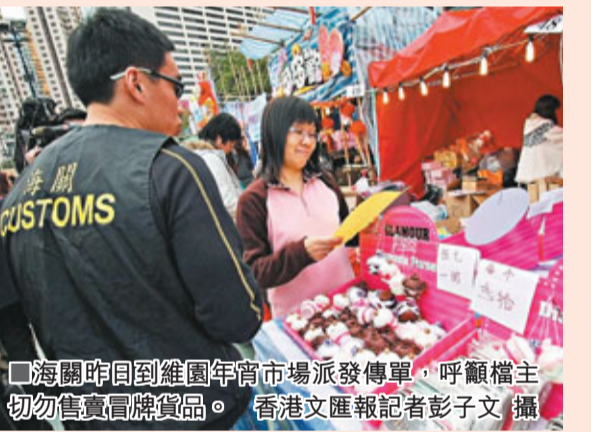
海關昨日到維園年宵市場派發傳單,呼籲檔主切勿售賣冒牌貨品。

品涉及侵權,當局亦會跟進處理。根據《商品說明條例》,任何人士售賣冒牌或有虛假商品說明的貨品即屬違法,一經定罪,最高可被罰款50萬元及監禁5年。市民如懷疑有人涉及售賣冒牌貨品活動,可致電海關24小時熱線2545 6182舉報。