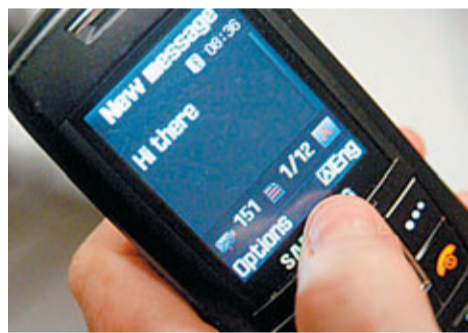
■很多人以短訊替代通話。