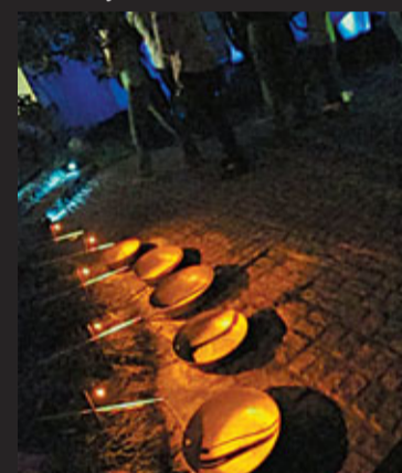
Jony Easterby: Nokia Puja