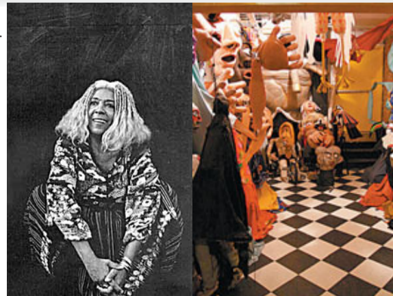
拉瑪瑪劇團檔案室一角。

Excellence in Theatre)。由她領導的La MaMa是不折不扣的劇場文化大使，足跡遍佈美洲、歐洲、澳洲、亞洲等多個國家，2006年曾到台灣為台北藝術節演出開幕劇目《酒神》(Dionysus)主體。