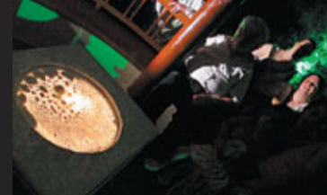
Jony Easterby: Tsunami