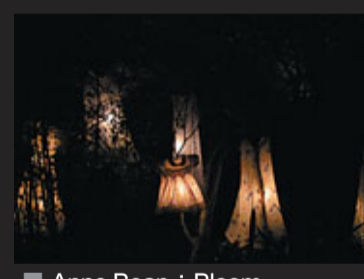
Anne Bean: Bloom