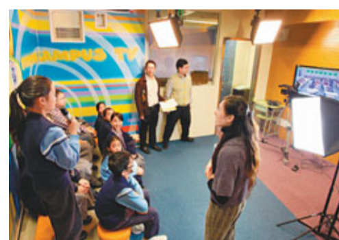
一班學生正與上海學生進行視像交流。