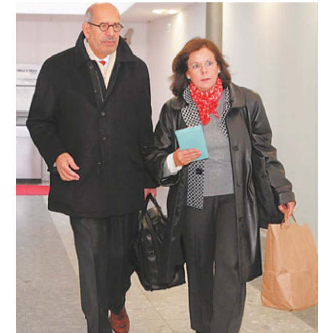
巴拉迪(左)昨日與妻子離開奧地利維也納，前往埃及。

日本九州南部鹿兒島和宮崎縣交界的霧島山新燃岳火山，昨日凌晨和下午先後發生歷來最大規模爆發。當局封鎖附近2公里範圍，並疏散居民。火山灰及岩石噴至6,500呎(約2公里)高空，影響日本國內航線及鐵路交通，無造成傷亡。