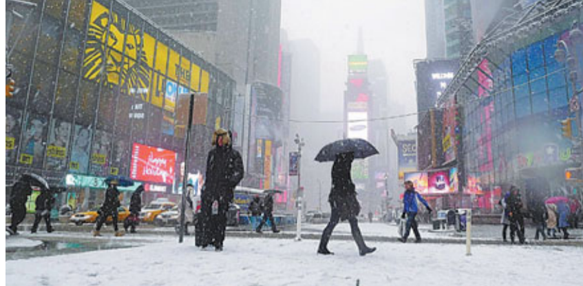
紐約降大雪，時代廣場一片白茫茫。