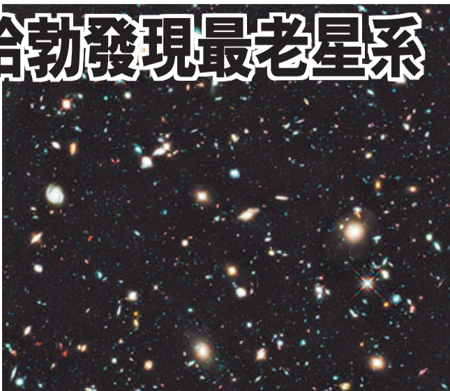
哈勃望遠鏡所拍攝過最深的宇宙影像。

天文學家昨日表示，美國哈勃太空望遠鏡捕捉到可能是至今發現最古老的星系。該星系微弱的光影在132億光年外，意味它在開天闢地的「大爆炸」後約4.8億年誕生，當時宇宙仍處於嬰兒期。新發現的星系UDF-39546824，是科學家在2009和去年花了87小時掃描後，才在天際中指甲般大的區塊發現。該星系雖古老，但大小卻遠不如後起之秀，只有銀河系的百分之一。