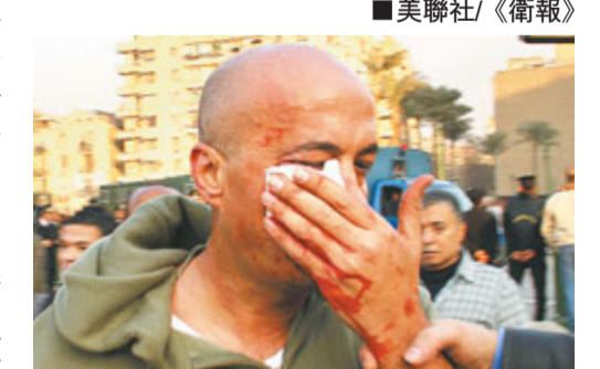
這名美聯社記者採訪時，被警員打至右顴骨碎裂，血流如注。美聯社

申克憶述，該批「青年」原來是埃及國家保安部隊的便衣探員，他說：「我嘗試用英語和阿拉伯語表明外國記者身份，反遭到更多拳頭和掌摑，旁邊很多示威者的遭遇和我一樣。」他再向一名高級警官表明英國人身份，但再被打，對方還以阿拉伯文回罵「去你的英國人」。