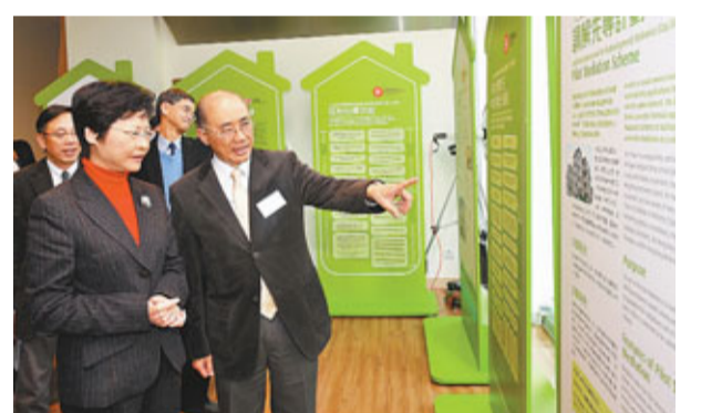
林鄭月娥參觀介紹「調解先導計劃」及「支援長者業主外展服務先導計劃」的展覽。

立法會現正審議競爭條例草案，消委會主席張炳良昨表示，希望議員不要單從工商界角度出發，應多從消費者角度考慮，當局也需小心考慮豁免範疇。他提醒市民須注意預繳式消費，希望政府盡快落實收緊商品說明條例，保障消費者權益。