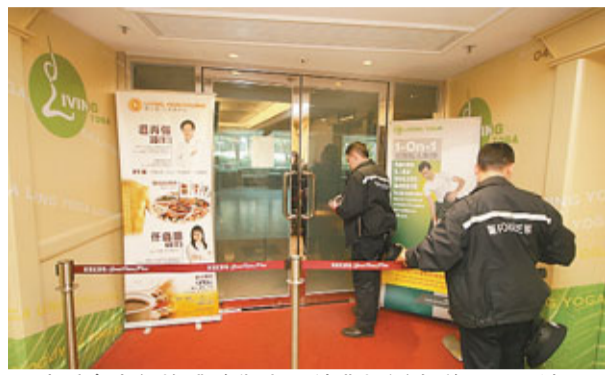
消委會去年接獲瑜伽中心結業投訴大增68%，達862宗。圖為LIVING YOGA結業。資料圖片