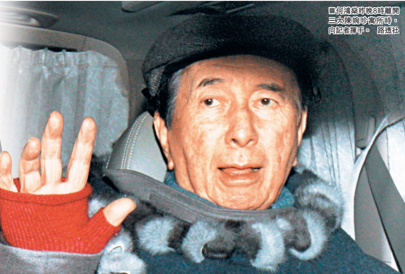
何鴻燊昨晚8時離開三太陳婉珍寓所時，向記者揮手。