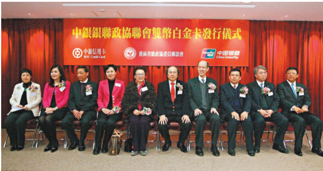
嘉賓出席中銀銀聯政協聯雙幣白金卡發卡儀式。

香港文匯報訊(記者 解玲)港區省級政協委員聯誼會位於灣仔海外信託銀行大廈8樓的會所昨日歡笑洋溢,近百委員及嘉賓出席「中銀銀聯政協聯雙幣白金卡發卡儀式」,共迎辛卯新春。委員們當場領到了「一卡雙幣、雙卡合一」的白金信用卡,便擁有一張兼具雙幣信用卡及會員證功能的獨特信用卡。