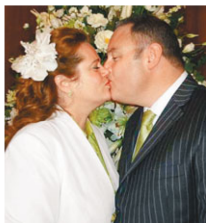
英情侶在愛丁堡完婚(見圖)。《每日郵報》

此後,他們去年連續7次結婚都失敗收場,例如去年6月訂婚禮場地,但被另一對出價更高的情侶搶去。一個月