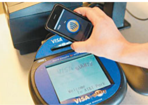
手機採用NFC功能付款的模擬圖。

英國《金融時報》前日報道,下一代iPhone預計將搭載「感應式付費」(wave and pay)技術,為蘋果進軍交易業務開闢大門。