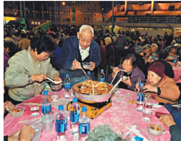
區內人士一同參與是次晚宴,感受油尖旺區關愛共融的一面。

香港紅十字會醫護服務部今年是連續第3年舉辦「人道關懷福滿載」活動,以推動了社區關懷,令社區人士透過積極的行動,關心身邊的長者,使他們感受到來自同一天空下的關愛,享受溫清滿溢的春節。