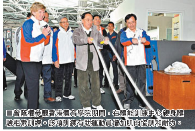
曾蔭權參觀香港體育學院期間，在體能訓練中心親身體驗組索訓練。該項訓練有助運動員增加肌肉協調和耐力。

愈揭愈臭 廉政公署日前正式介入調查社民連在所謂「五區公投」後的選舉開支申報，並到社民連總部搜證。社民連主席陶君行昨日接受文匯報查詢時證實，日前已將候選人的開支單據轉交廉署，需要時會協助調查；而廉署則表示不評論個別個案。面對廉署調查，「陶派」及「黃派」為高舉「清者自清」的貞節牌坊，繼續「槍頭互指炮照發」，「錢債糾紛」可謂一發不可收拾。剛退黨的立法會議員陳偉業昨日更召開記者會力證自己清白，反指社民連賬目混亂，揚言陶君行再要求他還錢的話會立即報警；陶君行回應時反擊稱，混亂的從來只有陳偉業，相反，社民連只是依單出納，勸喻陳偉業不要再在財務上作無謂糾纏。