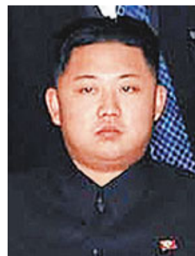
朝鮮領導人金正日幼子金正恩。