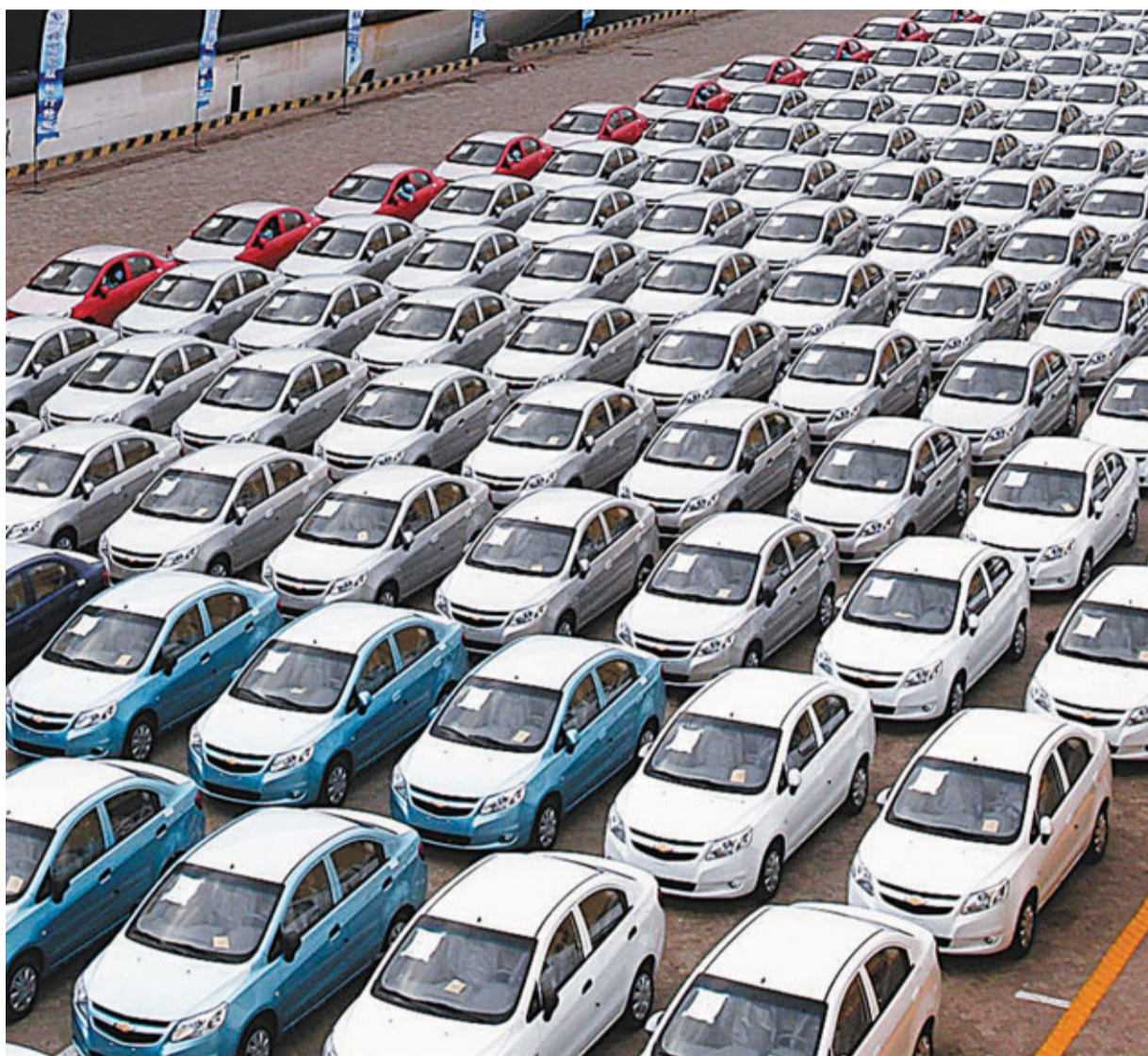
美國通用汽車公司去年在中國賣出235萬輛汽車，較在美多賣約13.6萬輛，歷史性首度超越本土銷售量。