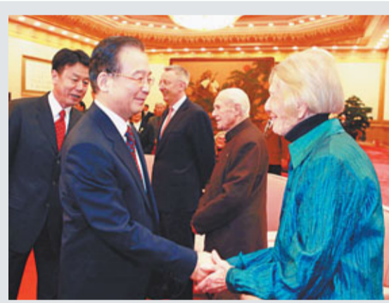
溫家寶總理在座談會前，與外國專家親切握手。