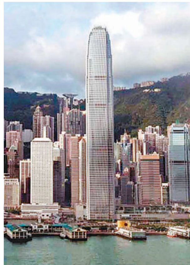
■外匯基金去年錄得790億元投資收入，較09年下跌27%。