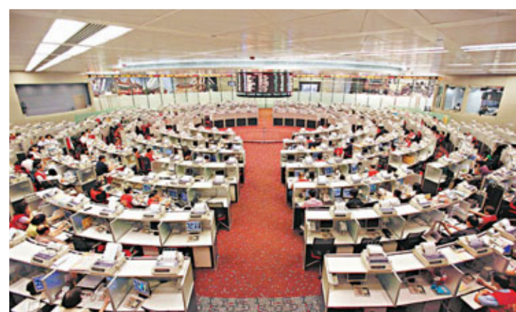
■外匯基金去年投資回報跑輸港幣。