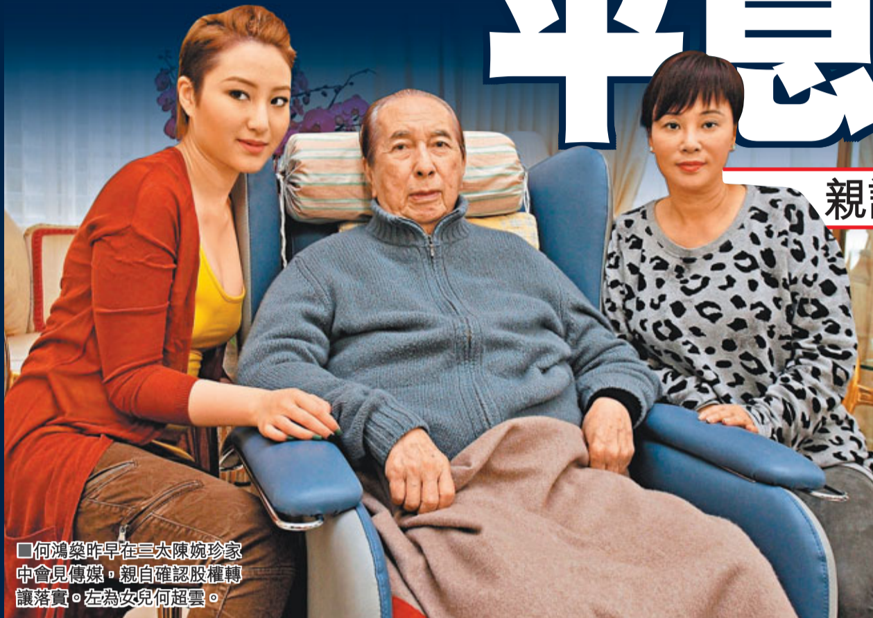
何鴻燊昨早在三太陳婉珍家中會見傳媒,親自確認股權轉讓落實。左為女兒何超雲。

香港文匯報訊(記者 聶曉輝)「賭王」何鴻燊因澳博股權轉讓而出現的「分產風波」,昨日終在他首度透過電子傳媒開腔而告平息。他親口確認日前將澳博股權分配予「二房」子女及「三房」太太陳婉珍的決定,更指「大問題已解決了」,不希望再作任何變動,又指已不再需要其私人律師高國駿,為風波一錘定音。至於「四房」太太梁安琪,昨日則兩度到陳婉珍的寓所,其後又陪同何鴻燊返回淺水灣大宅至下午才離去,沒有就事件作出回應。