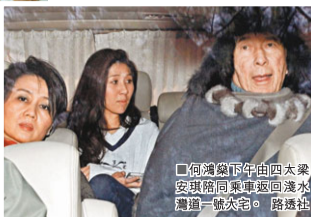
何鴻燊下午由四太梁安琪陪同乘車返回淺水灣道一號大宅。

但現在不需要他了,因為大問題已解決了,家人都很開心。」他指出,不希望有關落實作出變動。