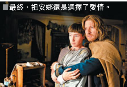
最終，祖安娜還是選擇了愛情。

祖安娜醫術日趨精湛，被推薦為病重的教皇醫病。她深得賞識，很快便扶搖直上，成為他身邊的紅人。公元853年，教皇聖良四世駕崩，祖安娜獲選為繼任者，獲封為若望。一個女子，竟然能權傾天下？她企圖改革種種陋習和社會不平等。可是，她越攀越高，身份便越容易被揭穿。權力和愛情，她又會選擇哪一樣呢？