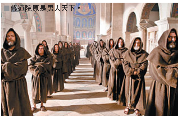
修道院原是男人天下。

導演表示，演員來自五湖四海，電影最終選定以英語作為主要語言，過程便要進行大量翻譯工作。「整個拍攝歷時兩個月，在德國中部、西部及摩洛哥取景。由於是史詩式劇本，劇組在服裝造型及場景佈置，都費盡心思。」設計總監Bernd Lepel，務求把最逼真的中世紀風貌呈現出來。「大家看片時，可留意戲中女主角童年居住的小村莊、修道院及各大城鎮。通通都是按歷史記載而精心建造佈置。」Bernd Lepel指，導演強調要造出中世紀骯髒混亂效果，泥土和灰塵也成為重要道具。而來自羅馬尼亞的服裝指導Esther Walz表示，所有服裝都經過考證查驗，全合乎中世紀史實。「可是，畢竟這是電影，也不能通通跟足史實。例如，中世紀普通人都有嚴重爛牙問題，這細節也不得不略過了。」