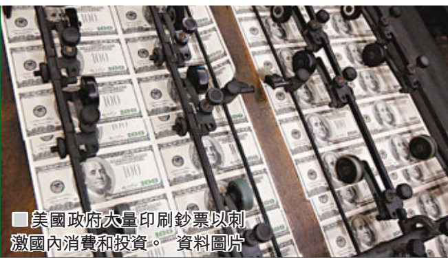
美國政府大量印刷鈔票以刺激國內消費和投資。