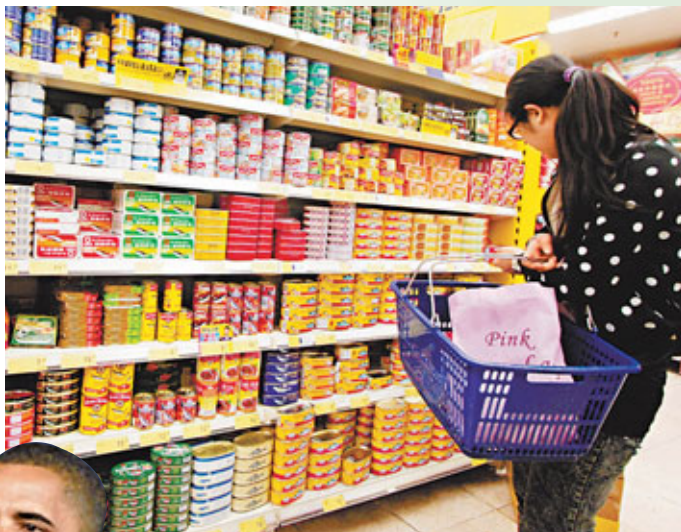
受到內地通脹影響，本港食材價格平均上升15%，基層市民百上加斤。 資料圖片

二戰後布雷頓森林體系確立以美元為中心的世界貨幣體系。建立「美元—黃金」本位制後，各國只有透過與美國貿易、賺取美元才能購買或儲備黃金。因此，美元成為國際貿易的結算貨幣和各國的儲備貨幣。而美元亦是美國的本國貨幣。這意味美元具有作為國際貿易結算貨幣和本國貨幣的雙重性。因此，美國的貨幣政策或將直接影響國際貿易及各國資本的流通方向，進而影響其他國家的經濟表現。