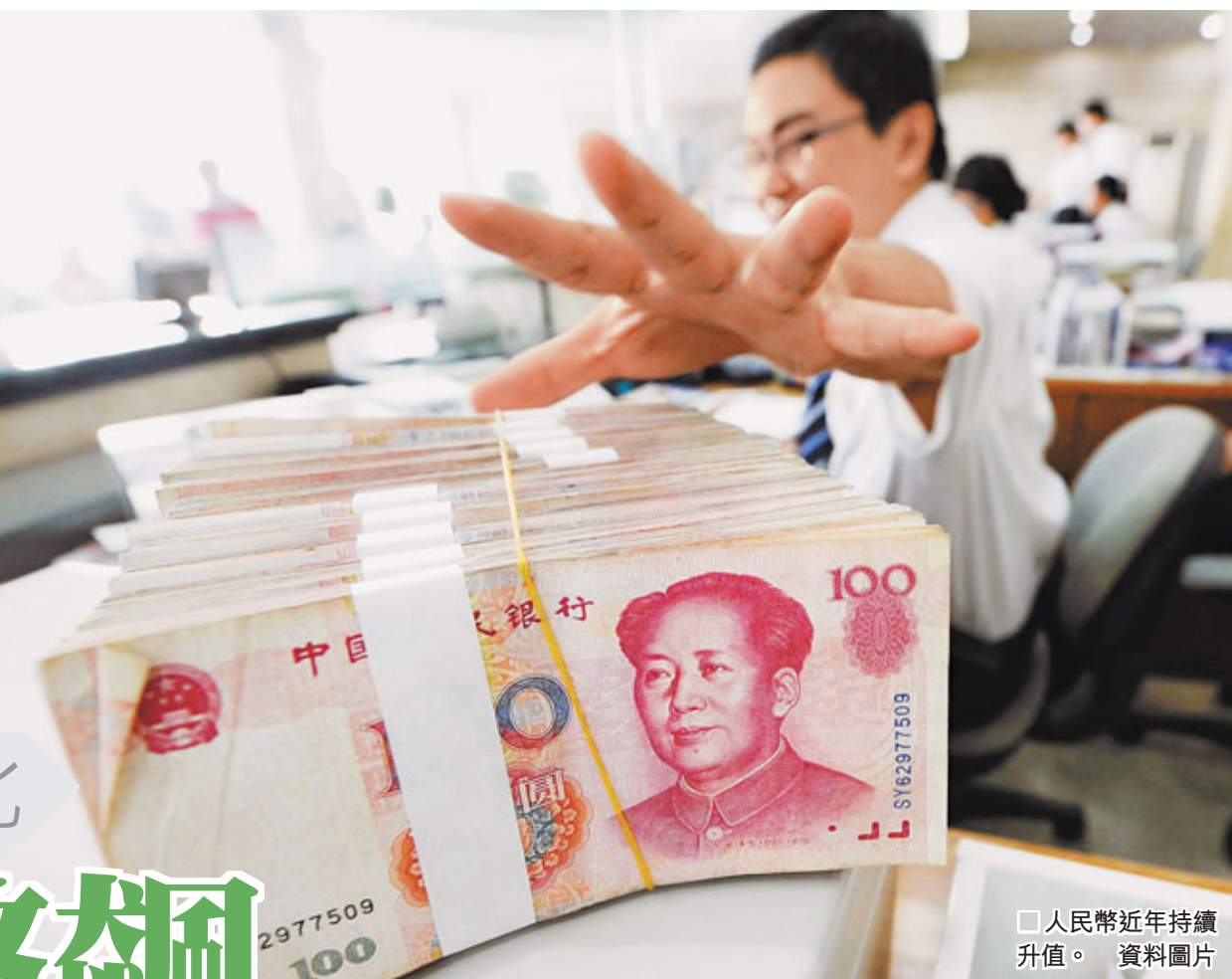
人民幣近年持續升值。 資料圖片

香港浸會大學中國研究課程成立於1989年，至今已培養近兩千名本科生，為香港歷史最悠久的中國研究課程。香港文匯報與浸大中國研究課程合作推出通識專欄，以專業的角度，深入淺出地探究中國在社會民生、城市規劃、經濟轉型、外交政策等多方面的最新發展，為本港高中生提供具權威性的「現代中國」通識科單元學習材料。