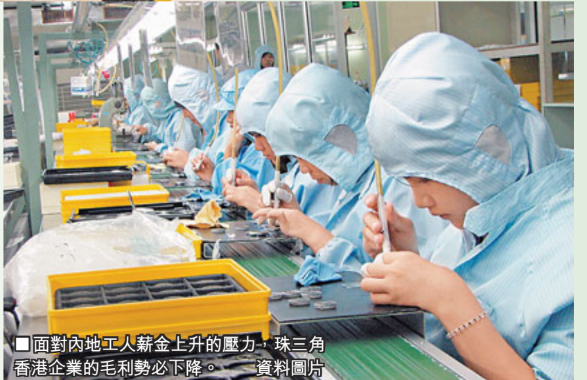
面對內地工人薪金上升的壓力，珠三角香港企業的毛利勢必下降。