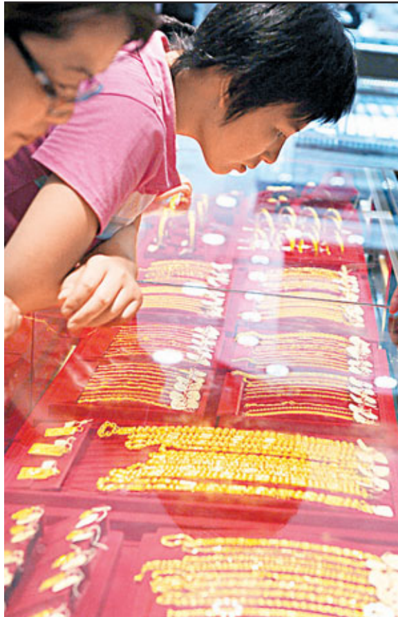
近年金價節節上升。 資料圖片

面對市民積怨已久的高樓價，港府若過分壓制市場或影響本地營商環境，但若採取「以不變應萬變」的策略則必遭更大輿論壓力。如何有效抑制炒風以穩定資產價格是對港府管治威信的挑戰。