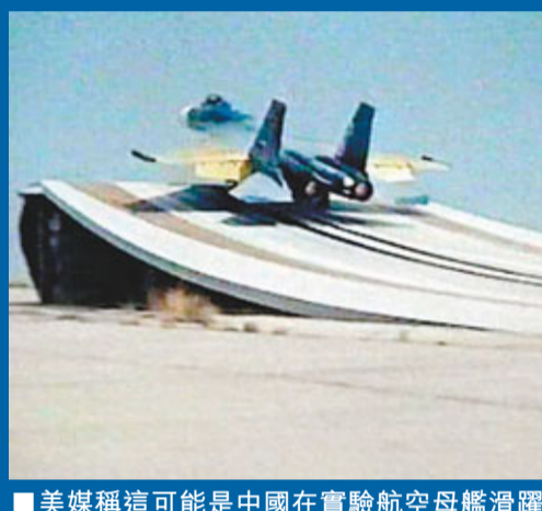
美媒稱這可能是中國在實驗航空母艦滑躍型飛行甲板。