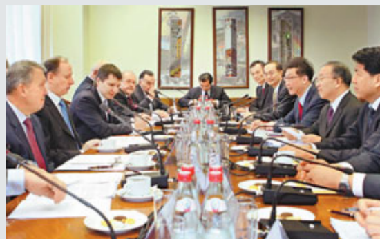
24日,中國國務委員戴秉國(右二)與俄羅斯聯邦安全會議秘書帕特魯舍夫(左二)舉行磋商。

據公開資料顯示,薛恆,男,漢族,1955年11月生,1973年參加工作,在職研究生學歷。2002年3月任遼寧省民政廳副廳長、黨組副書記,2003年3月任遼寧省民政廳廳長、黨組書記,2007年2月任中共丹東市委書記,2010年8月任中共營口市委書記。