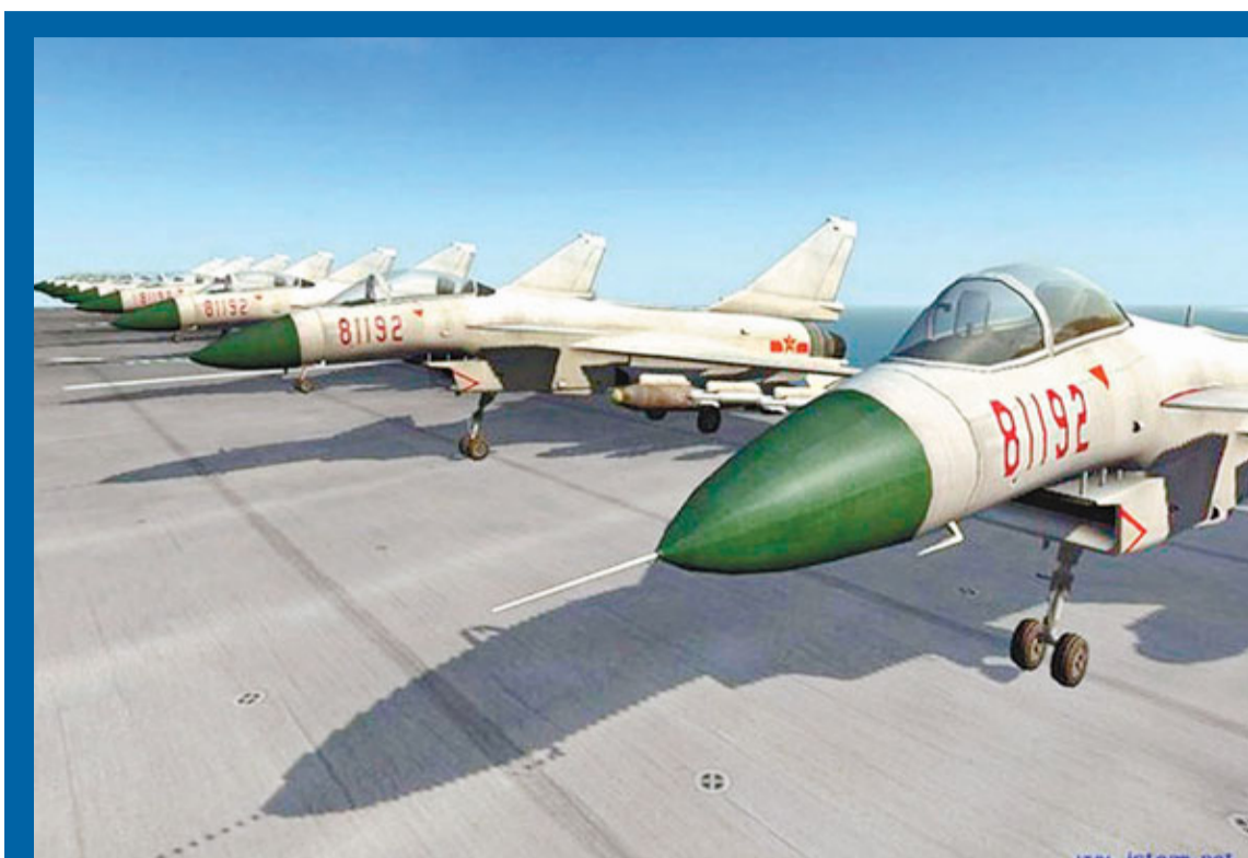
中國航母艦載機群想像圖。

專家表示,一般而言,艦載機飛行員的起降訓練,大都從陸地模擬甲板開始,熟練後再到真正航母的甲板練習。因此擁有艦載機訓練平台,才能為航空母艦培訓出合格的艦載機飛行員,令其擁有真正的戰鬥力。鑒於從選址到建設需較長時間,且需要與預定使用的航母相匹配,艦載機訓練中心堪稱打造艦載機配合的關鍵要素,且寶貴程度不亞於航母本身。