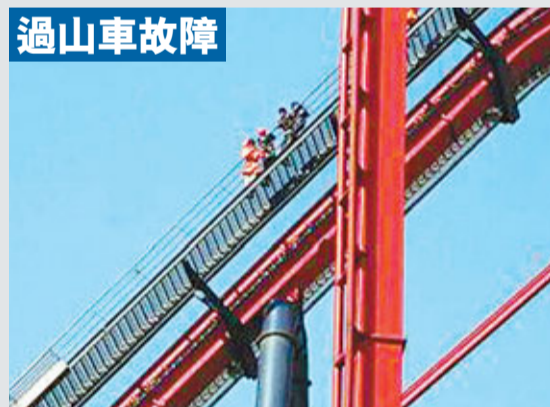
上海歡樂谷的「絕頂雄風」過山車,24日運行至60米最高點時,突發機械故障,25名遊客懸在半空中長達半個多小時。之後遊客在工作人員的護送下,通過軌道兩側的緊急樓梯返回地面。故障初步判斷為雨雪低溫導致傳感器損壞。

據外媒報道稱,美國聯邦法院判處一名向中國出售軍事機密的原B-2隱形轟炸機設計師——66歲的印度裔工程師諾希爾·戈瓦迪亞32年監禁。美國一個聯邦陪審團去年8月裁定,戈瓦迪亞出售軍事機密和幫助中國設計隱形巡邏導彈罪名成立。