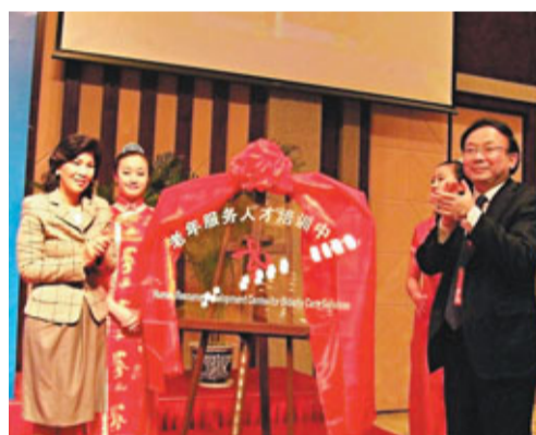
內地規模最大的「老年服務人才培訓中心」21日在南京揭牌並投入使用。

香港文匯報訊(記者 沈婷 南京報導)伴隨着社會老齡化的進程，目前中國60歲以上人口超1億，佔總人口12.5%，政府正在制定老齡事業發展「十二五」規劃。從21日召開的首屆「老年服務亞太地區國際論壇」獲悉，作為內地最早進入老齡化的省份，江蘇現已啟動建設內地規模最大的鍾山老年服務業示範園，總建築面積達13萬平方米，涵蓋人才培養、科研、產業經營等綜合功能。