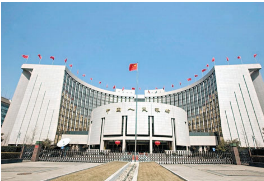
人為舒緩流動性緊張，暫停發行票據，讓銀行保留資金。

不過，人行今次暫停央票發行，亦實屬無奈之舉，現時央票一、二級市場利率倒掛嚴重，市場缺乏認購意願，發行規模難以放量。