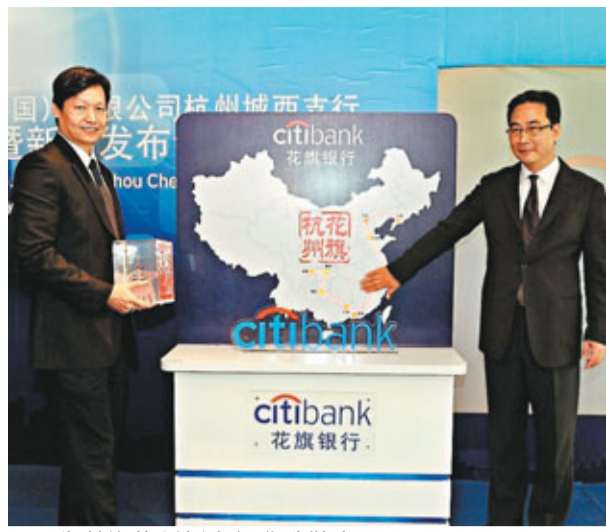
圖為花旗杭州新支行啟動儀式現場。