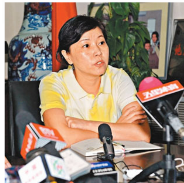
■國家隊領隊周繼紅強調跳水隊人才輩出。

當奧運4金得主、跳水女皇郭晶晶悄然退役，中國跳水「夢之隊」不會受到打擊，領隊周繼紅表示，中國跳水是一個團結向上的集體，除了郭晶晶以外還有很多優秀運動員，年輕隊員會以他們為榜樣，激勵自己更加努力。