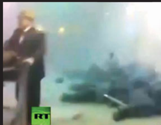
■現場人士拍下片段，可見多人倒臥地上。