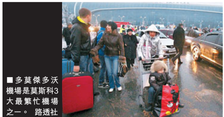
■多莫傑多沃機場是莫斯科3大最繁忙機場之一。

多莫傑多沃機場擁有最現代化的技術裝備，使其貨運量不僅在俄羅斯國內也處於領先地位，在旅客運輸數量方面也超過了俄羅斯境內的其它機場。根據2009年頭9個月的總結資料，該機場總的客運量超過1,400萬人，佔莫斯科航空樞紐總數量的45.4%。