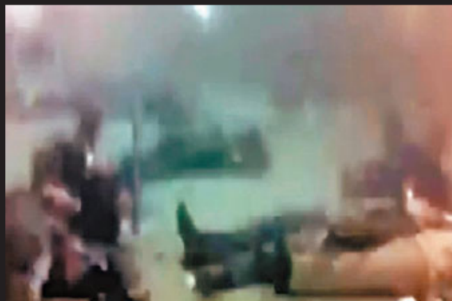
■機場大堂滿地死傷者，場面恐怖。

2004年2月6日 莫斯科一列地鐵在行駛中發生爆炸，造成近50人死亡，130多人受傷。當局相信是車臣叛軍所為。 ■綜合報道