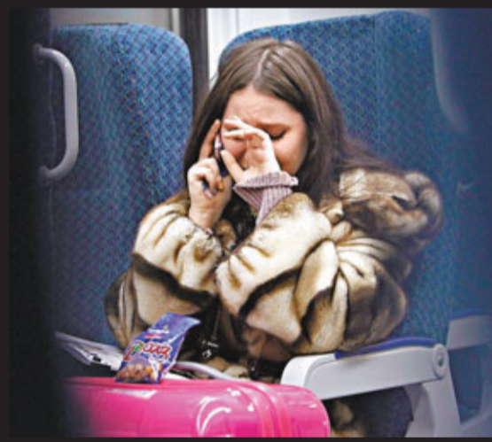
■一名女子邊哭邊向家人報平安。