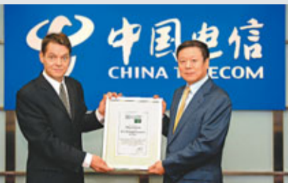
中國電信董事長王曉初(右)接受獎項。

中國電信(0728)良好的公司管治最近再獲國際權威財經雜誌肯定。中電信在財經雜誌《Euromoney》最新年度亞洲最佳管理公司評選中，不僅再次獲投資分析師投票選為「中國最佳管理公司第一名」，更在亞洲所有行業綜合評選中，再次獲選為「亞洲最佳管理公司第一名」，成為首家公司連續兩年獲得這項榮譽。同時，中電信亦在單項評選中獲得亞洲「最佳企業管治獎」、「最令人信服企業戰略獎」及「管理層最樂於與資本市場溝通獎」。