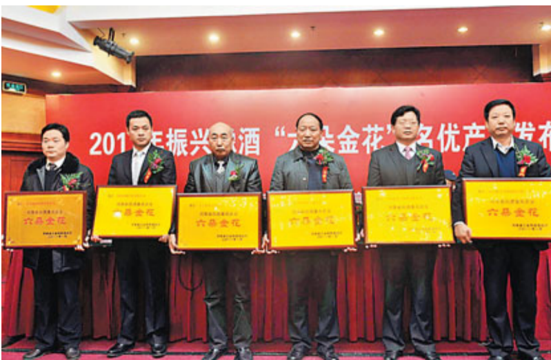
豫酒「六朵金花」香港文匯報訊(實習記者高揚 鄭州報道)從日前舉行的振興豫酒「六朵金花」名優產品發布會獲悉，寶豐、杜康、賒店、宋河、仰韶、張弓六家豫酒骨幹企業被河南省工業和信息化廳授予河南白酒「六朵金花」稱號。

業群。產業發展方面，壯大煤電和化工產業，並發展先進製造業、培育戰略性新興產業。城市建設方面，統籌城鄉發展，融入合肥經濟圈，建設生態宜居城市。 楊振超介紹，淮南煤炭探明儲量150餘億噸，年產量已近億噸，並已建成7大火力發電廠，正在建設的煤化工基地，規模居華東首位。另外，淮南已建成6家省級開發區，並在過去5年引進資金765億元(人民幣，下同)，外資6.7億美元。其中，裝備製造業、現代服務業等方面均取得較大發展，吸引鄭州煤機、陝汽重卡等一批企業落戶。他預計淮南市在去年生產總值達到600億元，財政收入超過100億元。楊振超表示，淮南市去年完成400億元固定資產投資，其中有70億元來自民間資本。