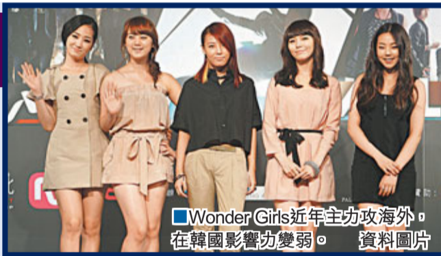
Wonder Girls近年主攻海外，在韓國影響力變弱。資料圖片