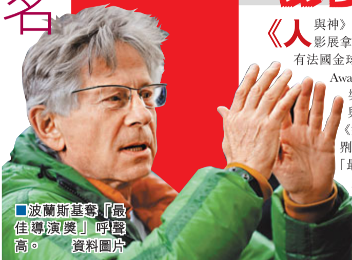
波蘭斯基奪「最佳導演獎」呼聲高。資料圖片

有法國奧斯卡之稱的第36屆《凱撒電影頒獎禮》於法國時間1月21日，在巴黎公佈提名名單，當中由Xavier Beauvois執導的《人與神》分別獲得最佳電影、最佳導演、最佳男主角等共11項提名，撼贏只得8項提名、由波蘭斯基(Roman Polanski)執導的《影子滅殺令》，先勝一仗。