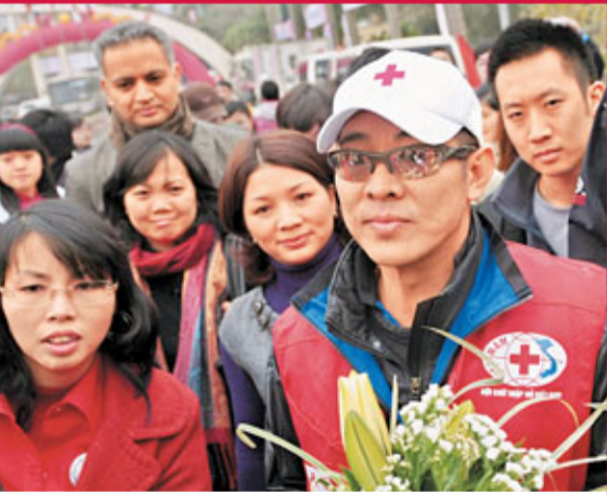
李連杰獲大會贈送花束。