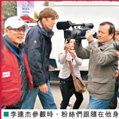
李連杰參觀時，粉絲們跟隨在他身旁，更沿途拍下他的英姿。

初次到訪越南的李連杰是應國際紅十字會邀請到達當地，他在當地人氣極盛、電影深受當地人歡迎。他昨日參與在河內青年公園所舉辦的一項捐血活動時，吸引不少影迷一早到達公園等候。