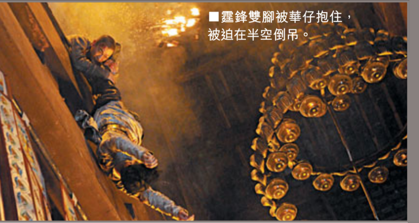
霆鋒雙腳被華仔抱住，被迫在半空倒吊。

要從9米9的佛祖像較高的上空位置徐徐的倚着整個佛祖像身而下，華仔飛跌下來時，身體不時碰撞到佛祖的像身，加上導演要求墮下的位置要剛好在雙佛手上，要靠自己用身體去平衡，難度相當高。華仔冒着手腳被碰擦之痛，試飛了好幾次，才掌握到竅門。華仔直言感覺很神奇：「如果不是拍戲，根本不會有這樣激盪的場面。我在半空滑過佛祖像的刹那，這麼近距離的接觸，感覺很寧靜祥和。可能我本身信佛，所以感受至深。」