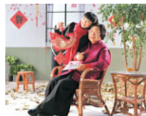
王昆(右)出演賀歲歌MV，與愛徒同送新春祝福。

香港文匯報訊(記者何凡北京報導)十歲的內地童星豆豆與其恩師、著名藝術家王昆攜手拍攝的賀歲歌曲《團圓飯》MV即將封鏡。年齡相差75歲的師徒將為全國人民同送新春祝福。而豆豆今年有望再次登上央視春晚的舞台，其參與表演的歌曲《愛你我就抱抱我》，作為唯一的少兒歌舞類節目，已進行了三次進組排練。此外，豆豆還參加了2011央視首屆網絡春晚的錄製。