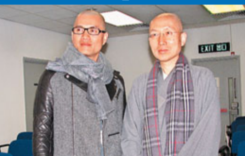
呂良偉（左）昨日出席港大講座，從佛教角度暢談「慾望與道德」。

香港文匯報訊（記者 李慶全）呂良偉昨日到香港大學為「慾望與道德」講座擔任演講嘉賓，阿呂向來篤信佛教，對於慾望的看法，他坦言信佛的人會將個人的慾望減到最低點，道德反之會放至最大，佛教徒會以他人利益為大前提，個人的事會是次位。