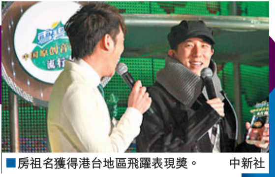
房祖名獲得港台地區飛躍表現獎。