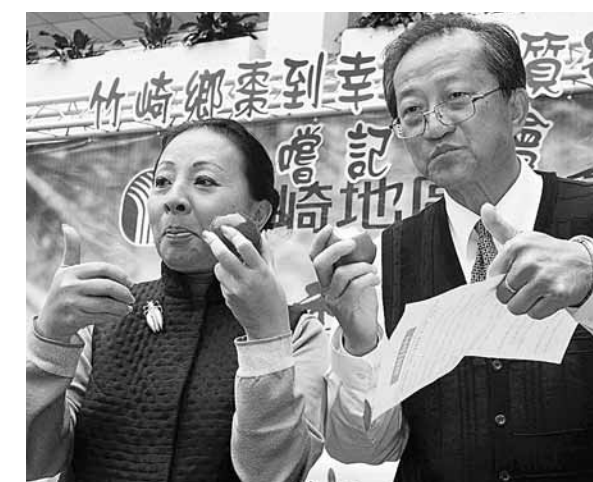
縣長促銷 嘉義縣竹崎鄉蜜棗進入盛產季節，縣長張花冠(左)21日在縣府中庭大力行銷當令水果，呼籲民眾多多購買「棗到幸福」的蜜棗。

VISA國際組織台灣區總經理麻少華表示，走過金融海嘯，去年一年，台灣地區信用卡簽帳金額超過新台幣1.5萬億元，創歷史新高，從整個消費動能來看，台灣地區經濟已走出谷底，邁向復甦之路。