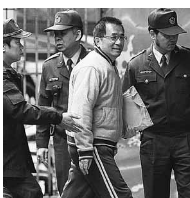
■扁家洗錢案21日更審庭，提訊入監服刑的陳水扁出庭應訊。

陳水扁於庭訊時花費1小時陳述，否認洗錢。他說，所謂的扁案，有很多部分重疊，好比日前二審獲判無罪的「機密外交」案，有一部分