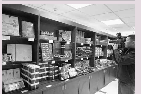
■辦事處內展示港口餅等基隆伴手禮，業者希望在大陸開出門店。

香港文匯報訊 (記者 林舒婕 廈門報道) 陸客赴台自由年內將啟動，台灣各縣市紛紛加快「登陸」行銷步伐。基隆市21日在福建廈門揭牌成立旅遊經貿文化辦事處，透過「常駐」方式深拓大陸市場。據了解，基隆是台灣首個赴大陸設旅遊經貿交流機構的縣市。