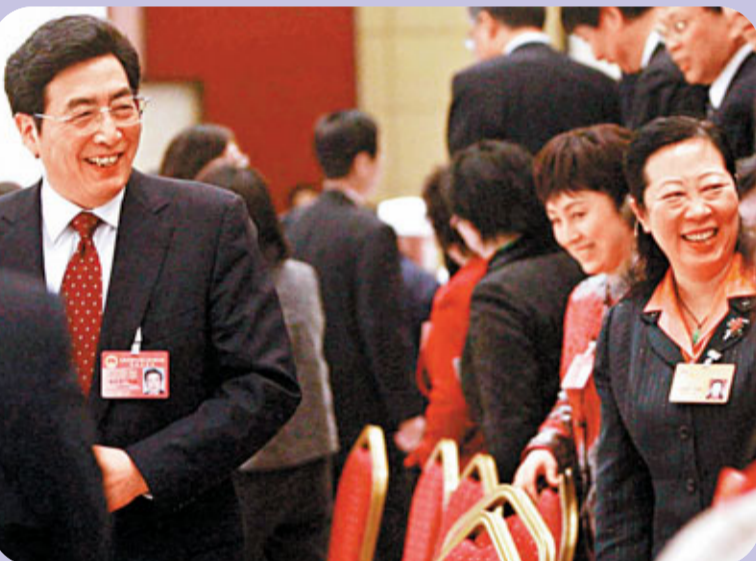
■北京兩會期間，北京市市長郭金龍與代表親切交談。