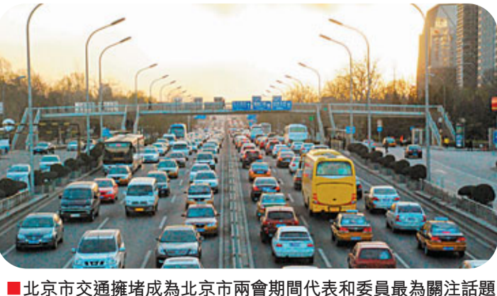
■北京市交通擁堵成爲北京市兩會期間代表和委員最爲關注話題

此外，除京滬客專外，北京目前正在建的還有京滬高速鐵路及北京客專，這兩條高速鐵路的終點站分別是上海和石家莊，設計時速均爲每小時350公里。其中北京客專計劃在今年年底建成通車，京滬高速計劃在今年6月底建成通車。