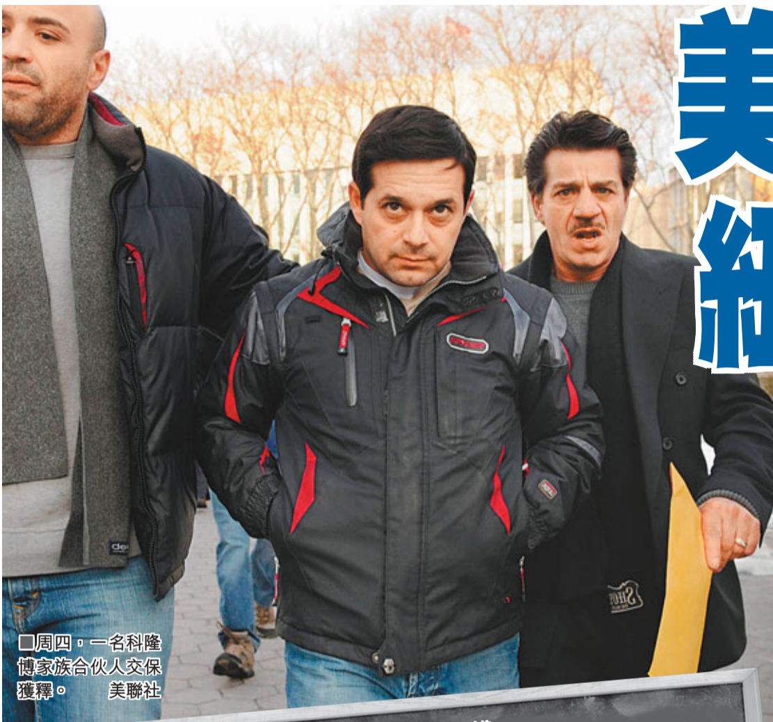
■周四，一名科隆博家族合伙人交保獲釋。