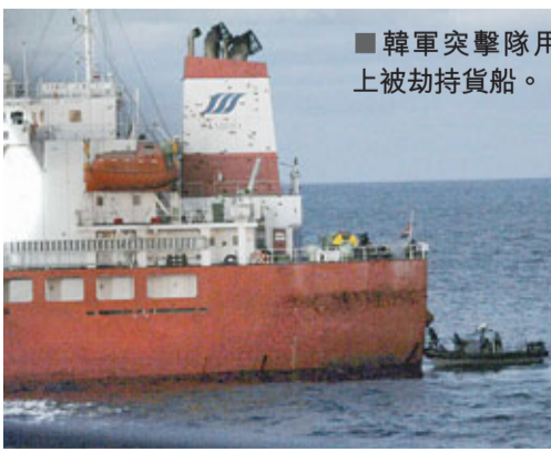
■韓軍突擊隊用小艇攻上被劫持貨船。