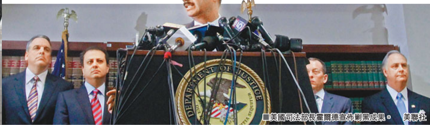
■美國司法部長霍爾德宣佈剿黑成果。