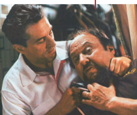
■荷里活電影《盜亦有道》(Goodfellas)部分角色以甘比諾家族成員為藍本。