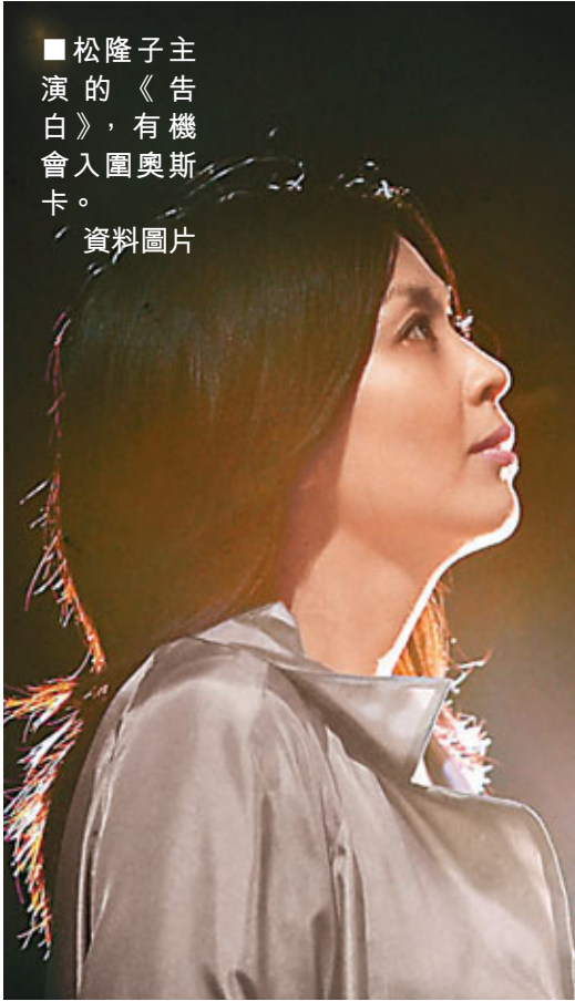
■松隆子主演的《告白》，有機會入圍奧斯卡。

美國時間1月19日，美國電影藝術與科學學院(AMPAS)公佈了第83屆奧斯卡最佳外語片第二批候選名單。內地導演馮小剛的《唐山大地震》、香港導演羅啟銳的《歲月神偷》和台灣導演鈕承澤的《艋舺》悉數出局。亞洲電影僅餘下日本的《告白》擠身9強之列，能否成功入圍，還看25日的5強提名結果。