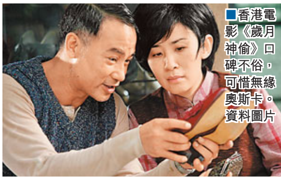
■香港電影《歲月神偷》口碑不俗，可惜無緣奧斯卡。 資料圖片