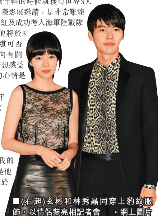
■(右起)玄彬和林秀晶同穿上豹紋服飾，以情侶裝亮相記者會。