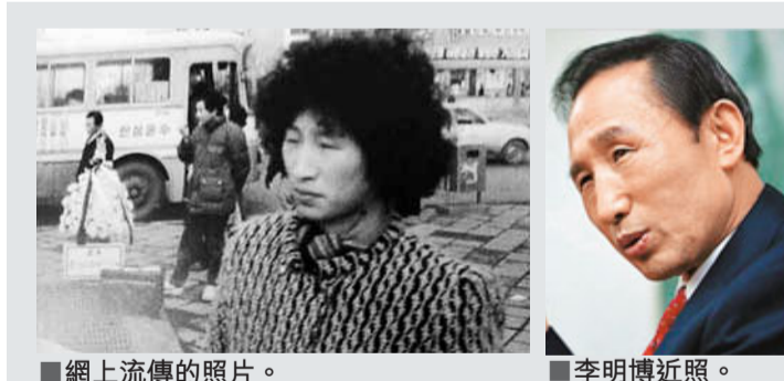
李明博「女裝」照熱傳 韓官方否認

化的擔憂。由於在野黨參院多數議席，新法案的前景難料。 沖繩部分訓練 轉移至關島 與此同時，日美兩國已就駐沖繩美軍基地戰機訓練達成協議，今年起部分訓練將轉移至關島進行。日本防衛大臣北澤俊美昨日向沖繩縣知事仲井真弘多說明有關協定，並要求沖繩縣對駐日美軍普天間機場遷移方案予以理解。仲井真重申，希望日本政府能修改去年的日美協議，將機場搬出沖繩。 根據日本外務省公布的日美協議，今後將移到關島的嘉手納基地戰機訓練，一次時間最長為20天，架次最多是20架，包括F-15戰機、空中加油機和預警機等，訓練計劃將由日美兩國政府協商制定。 ■共同社/新華社