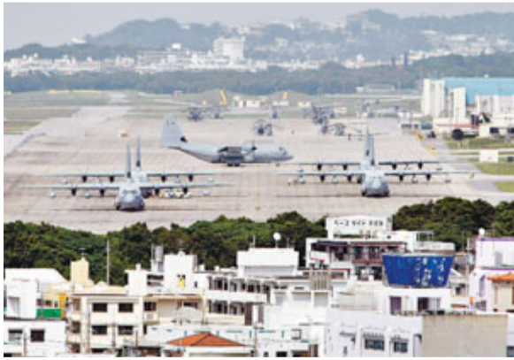
位於沖繩的美軍基地。 資料圖片

日本政府認為有必要在朝鮮半島發生突發情況時，擴充自衛隊對美軍的支援，已於前日開始研究修改《周邊事態法》，把自衛隊向美軍提供海上補給的地理範圍，從目前的日本領海擴大至公海，以提高美軍艦船的活動效率。最快今秋提交國會審議。 《周邊事態法》以朝鮮半島發生突發事件為假想，規定日本周邊地區發生對和平及安全產生重大影響的事件時，自衛隊將向美軍提供支援。鑑於朝鮮炮擊韓國延坪島後，朝鮮半島局勢升溫，日本認為有必要強化與美國的合作，通過擴充對美軍的支援以深化日美同盟關係。由於美方也提出請求，日本政府着手修改法律，把可進行補給的海域擴大至日本周邊的公海。 然而，日本國內存在著對自衛隊支援與美軍行使武力一體