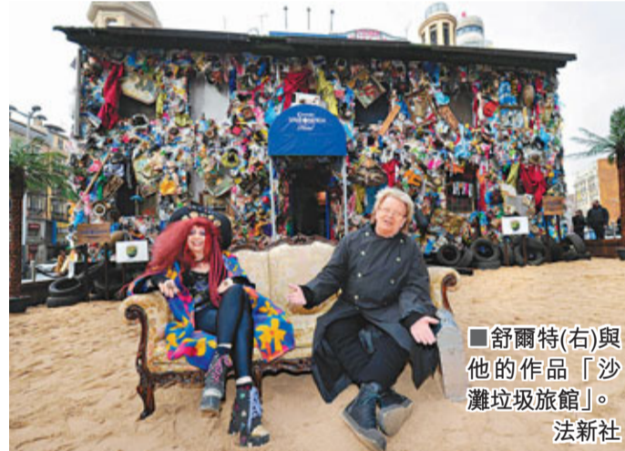
舒爾特(右)與他的作品「沙灘垃圾旅館」。

西班牙首都馬德里市中心近日迎來一家與眾不同的旅館，其全部建築材料都是垃圾，包括舊輪胎和破地毯等，這家旅館名為「沙灘垃圾旅館」。 這家位於卡拉俄廣場的旅館，主材料是被潮汐沖上海灘的碎石，其他裝飾材料30%以上是從英國、法國、德國、意大利及西班牙海灘上撿回來的垃圾，包括塑膠袋、木質相框、樂器、有斑紋的襪子、輪胎及兒童書本等。其中垃圾最多的要數意大利南部的海灘。 垃圾旅館大門前是一堆沙土和幾棵棕櫚樹，5個客房中有街燈、搖晃的餐桌、破舊的波斯地毯等。旅館還在社交網站facebook上舉辦競賽活動，獲勝的網友可免費入住這些「破房間」。 這幢新旅館由德國藝術家舒爾特建造，以迎接馬德里舉辦的國際旅遊展銷會。他說：「我之所以創建沙灘垃圾旅館，是因為我們的海洋已變成最大的垃圾堆。」此項工程的發言人皮格拉斯說：「我們想要向人們展示，如果我們不清理海灘，未來的度假勝地將會變成什麼樣。」 ■法新社