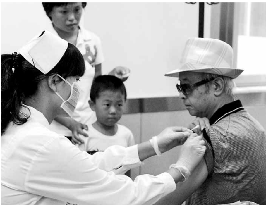
專家認為，有條件的地方，每年應該大規模接種季節性流感疫苗。圖為石家莊一位老人正接種季節性流感疫苗。

施，一旦出現發熱、咽痛等急性呼吸道症狀應儘快就醫。曾光指出，應該積極鍛煉身體，勤洗手，保持良好的個人衛生習慣。專家指出，盡量減少去空氣流通不暢、人員密集的公共場所，這是對自己最好的保護。