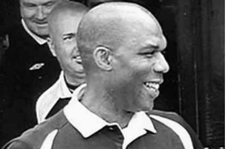
艾哈邁曾任職足球裁判。

英國一名色魔冒認頂尖物理治療師，以治療為藉口，性侵犯最少13名求診女子。他已認罪，或面臨長期監禁。案情指，他要求一名女病人把衣服脫光，準備上下其手，當受害人提出質疑時，他直截了當地說：「我是醫生，信我吧。」去年一名英國國家隊女運動員求診，他重施故伎，運動員報警，揭發事件。