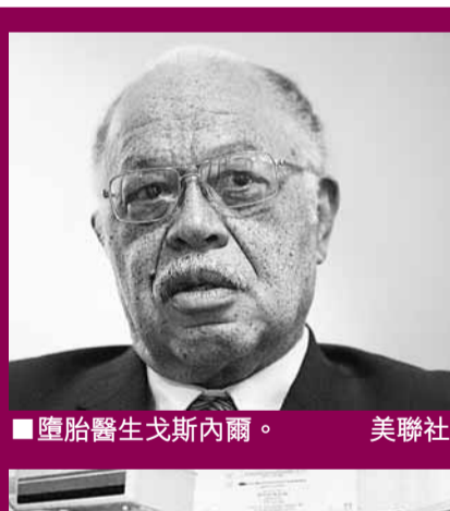
墮胎醫生戈斯內爾。