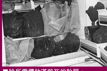
診所雪櫃放滿殺死的胎屍。