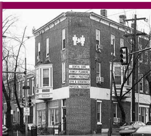
「婦女醫療協會診所」已被查封。