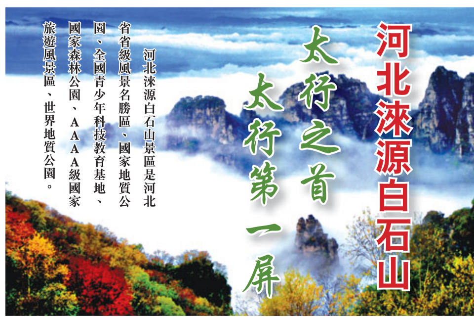
河北涞源白石山景區是河北省省級風景名勝區、國家地質公園、全國青少年科技教育基地、國家森林公園、AAA級國家旅遊風景區、世界地質公園。太行之首 太行第一屏 河北涞源白石山

不斷增加的暴力事件不斷干擾着卡拉奇的穩定。卡拉奇是巴基斯坦的商業中心,也是該國最大的城市,很多外國企業在此設有總部。