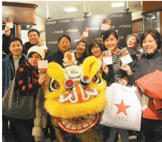
今年春節北京、廣州多家旅行社將再組千人團赴美過洛杉磯等地旅遊。圖為去年春節,中國千人團的部分遊客展示紐約梅西百貨贈送的「國際優惠卡」。資料圖片

香港文匯報訊 中新網20日電,據美國《世界日報》報道,中國大陸千人旅遊團去年赴紐約過農曆春節後,今年仍有千人旅遊團移師洛杉磯熱鬧過年,將為洛杉磯縣帶來商機。今年千人春節團由來自北京、廣州多家旅行社組成,包括五條在美過春節行程,逗留美國時間從8天至15天不等,其中停留南加地區三至四晚。一千多名遊客將於本月30日到2月1日分別從北京和廣州兩地出發。