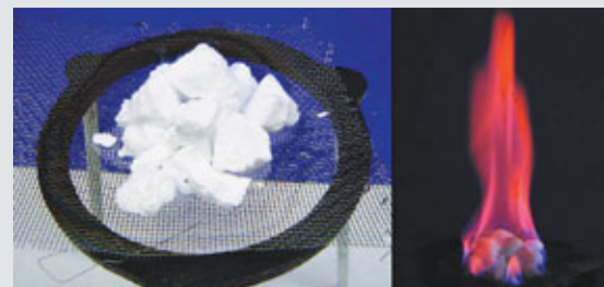
中國首次在海域鑽探獲取了天然氣水合物(可燃冰)實物樣品。資料圖片

■去年,廣東新批外商直接投資項目的平均合同外資金額不及江蘇等省。圖為意大利在華投資規模最大項目瑪切嘉利(中國)有限公司去年底在揚州投產。資料圖片 已經逐步由港臺中小資本轉變為跨國公司。在2007年商務部認定的365家帶有總部性質的外商投資性公司,其中上海佔43%,北京佔38%,廣州和深圳合計僅佔7%。據廣東科學技術情報所統計,全國外資研發機構40%以上集中在長三角地區,30%以上分布在環渤海地區,僅有18%分布在珠三角地區。同時,世界500強企業在華研發機構有進一步向長三角地區集中的趨勢。