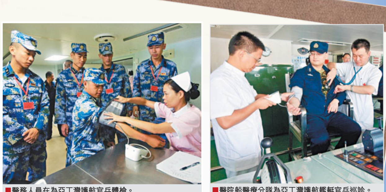
■醫務人員在為亞丁灣護航官兵體檢。 ■醫院船醫療隊為亞丁灣護航艦艇官兵巡診。