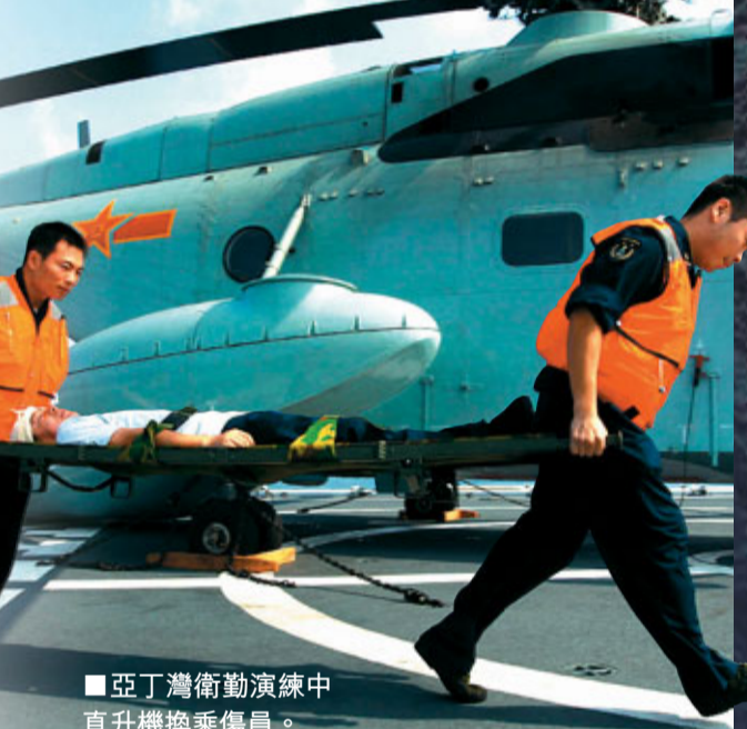
■亞丁灣演習中，直升機換乘傷員。

「和平方舟」號還設有海上撤離平台，主要用於重傷病員撤離母船使用，配備有6條救生艇。每條救生艇可以載員85人，艇上座椅可以換成擔架，可以放置擔架16副，載員28人，當母船發生重大險情時，6條救生艇可以同時出動，一次性撤離510人。在解放軍海軍剛剛結束的「藍天使命-2010」的非戰爭軍事行動醫療救護協同演練中，「和平方舟」號醫院船與設置在「微山湖」號綜合補給艦上的編隊醫療所，以及任務艦艇的軍艦救護所形成了海上三級醫療救護體系，為執行遠洋任務的海軍官兵提供了專業、完善的醫療救護服務。