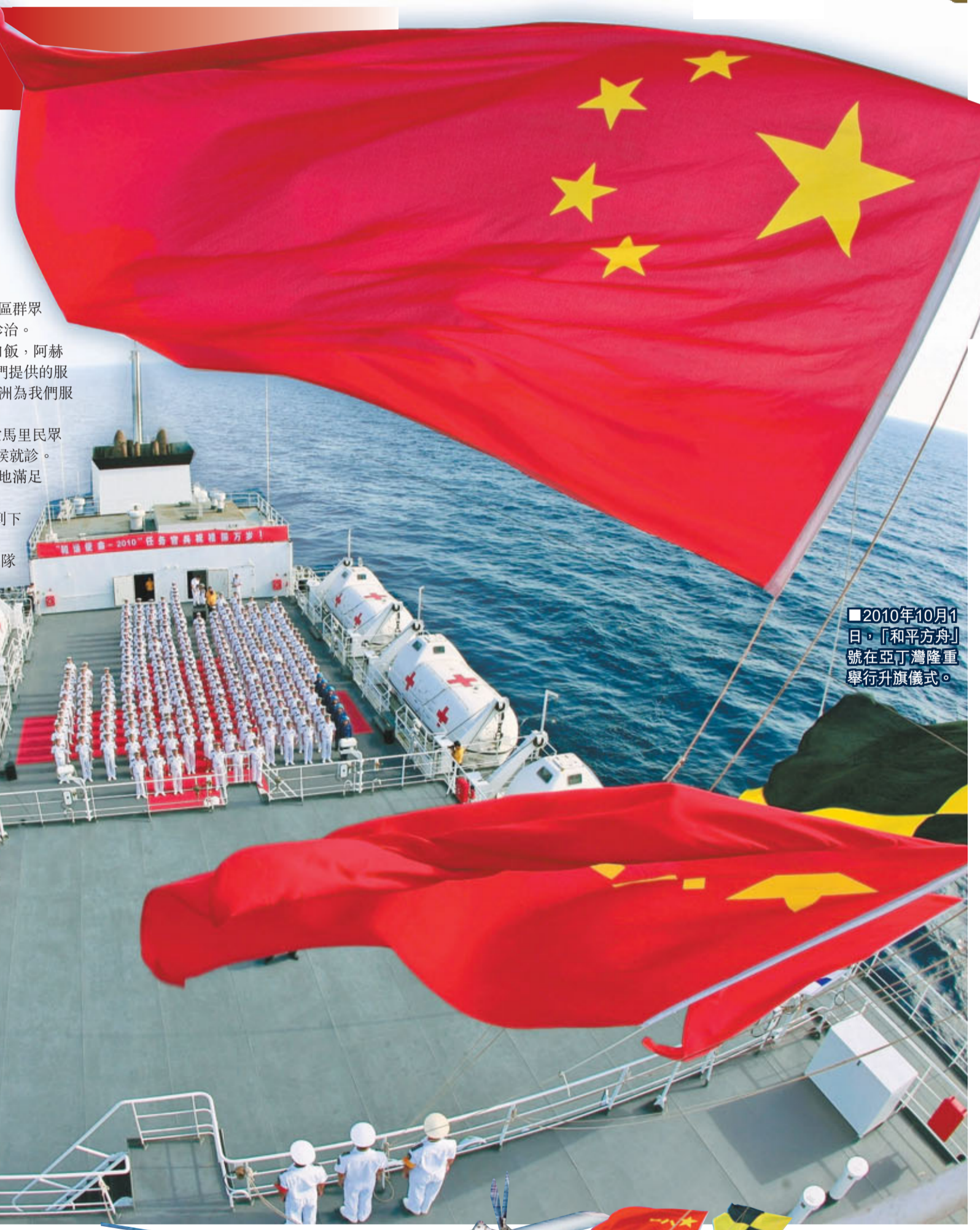
■2010年10月1日，「和平方舟」號在亞丁灣隆重舉行升旗儀式。