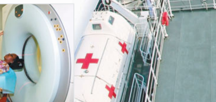
■「和平方舟」號醫務人員在為非洲民眾做檢查。

肯尼亞副總統卡隆佐·穆西約卡說：「『和平方舟』號醫院船的到來，為肯尼亞提供了先進醫療技術，並成為中肯長期友好關係發展的又一豐碑。」