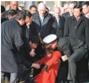
黨寶拉在歡迎儀式上突然昏倒。

香港文匯報訊 據路透社報道，國家主席胡錦濤訪問美國期間發生了一段小插曲，當胡錦濤搭乘禮車抵達白宮時，一名美國儀仗隊成員差點打不開車門，不過問題隨後很快就解決。