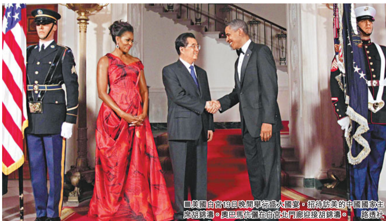
美國白宮19日晚間舉行盛大國宴，招待訪美的中國國家主席胡錦濤。奧巴馬伉儷在白宮北門廊迎接胡錦濤。