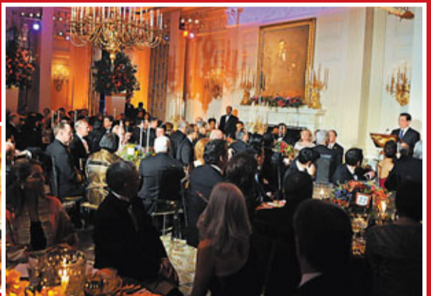
胡錦濤在國宴上致辭。