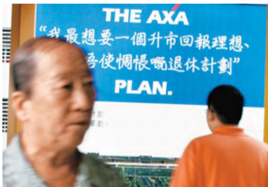
■強積金「半自由」遲遲未推出,AXA國衛保險卻率先並大幅削減管理費用吸客,由2%減至最低1%。

香港文匯報訊(記者 余美玉)強積金「半自由」一再押後,市場競爭並沒有因而放緩,向來並不活躍的強積金服務商AXA國衛保險趁勢重整陣容,推出全新強積金計劃,並大幅削減費用吸客,由2%減至最低1%,新客更可低至0.99%。該公司表示,冀在2015年前晉身為全港五大強積金服務商之一,管理資產由100億增加至400億元。