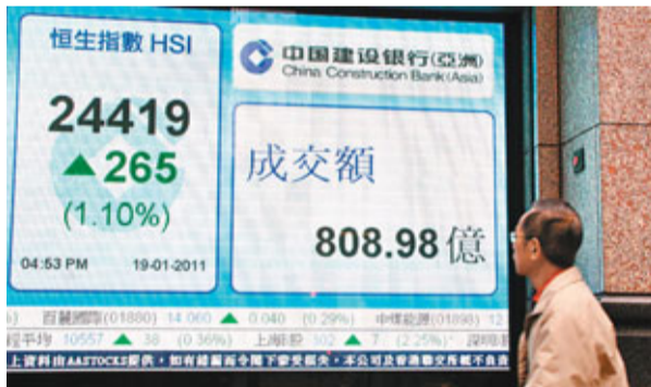
■中移動帶動恒指上升265.64點,收報24,419.62點。

葉尚志指出,其實近期港股在資金的推動下已走出一個相對獨立的行情,走勢強於A股,譬如上周一上證綜