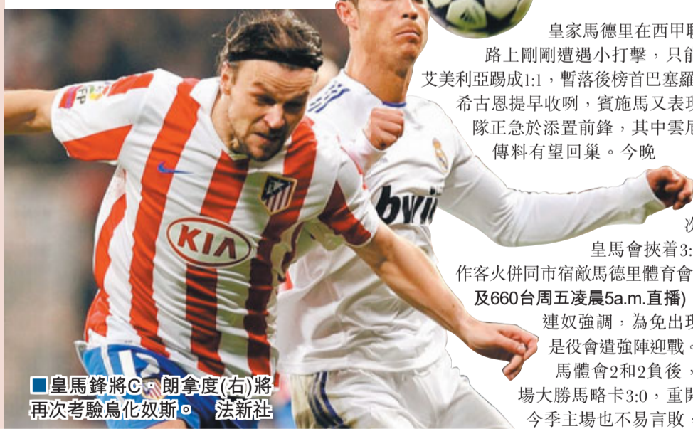
皇馬鋒將C朗拿度(右)將再次考驗烏化巴斯。

皇家馬德里在西甲聯賽爭標路上剛剛遭遇小打擊，只能作客與艾美利亞踢成1:1，暫落後榜首巴塞羅那4分。希古恩提早收場，賓施馬又表現差，球隊正急於添置前鋒，其中雲尼斯杜萊傳料有望回巢。今晚