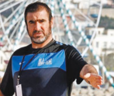
法國前名將簡東拿。

另外，昔日「荷蘭三劍俠」之一的48歲前名將古列治，正式執教去年位列俄羅斯聯賽第16位的格羅茲尼。古列治曾擔任英超車路士、紐卡素和荷甲飛燕諾的主帥，2008年離開洛杉磯銀河後，一直未有新工作。