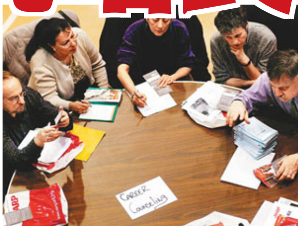
美國一個招聘會上，較年長失業人士在接受職業諮詢。