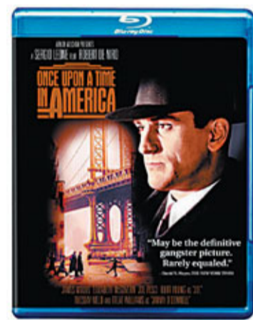
童年暗戀對象跳芭蕾舞的一幕。(網絡圖片)

此藍光碟版本大致跟幾年前的數碼重新修復DVD版本一樣，聲畫表現一般。不過，終於能再透過高清晰度重新觀賞，夫復何求！