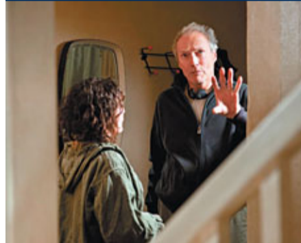
導演對每場戲認真指導。