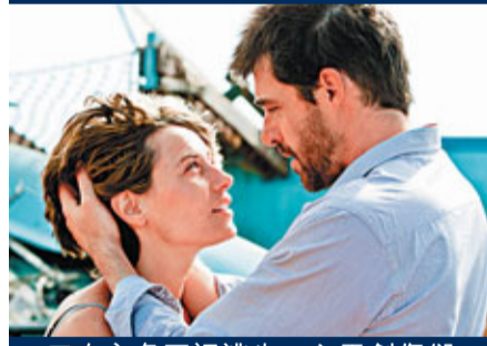
女主角死裡逃生，心靈創傷卻難以復元。