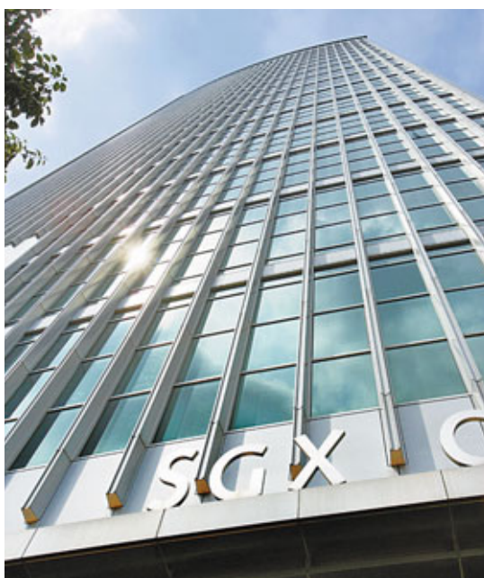
新加坡交易所搶在香港交易所之前，將股市交易時間延長。

有鑑於此，港交所由今年3月7日起，開市時間提早至9時半，午休時間縮短至一個半小時，令港股交易時段先行增至5小時；到明年3月進一步將午休時間縮短至一小時後，港股的交易時段才達至5.5小時。改革後，交易時段的長度在全球排名15位，不單仍低於主要的歐美交易所，亦低於馬來西亞、韓國、百慕達、孟買等交易所。