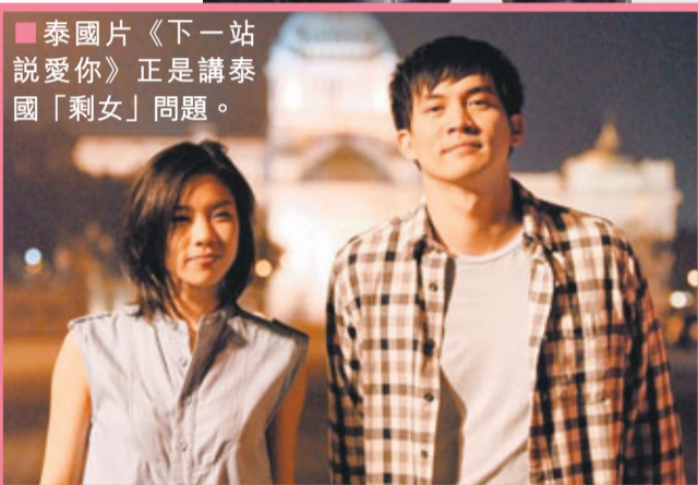
■泰國片《下一站說愛你》正是講泰國「剩女」問題。