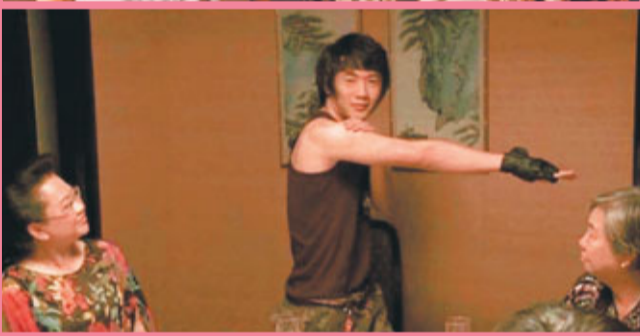
■美麗相親的對象竟是 騎呢版Rain。

曙光影視發行公司現送出《下一站說愛你》換票證30張予《文匯報》讀者，有興趣的朋友請剪下印花，連同貼上$1.4郵票兼註明「《下一站說愛你》換票證」的回郵信封，寄往香港仔田灣海旁道7號興偉中心3樓《文匯報》娛樂版，便有機會得獎。先到先得，送完即止。