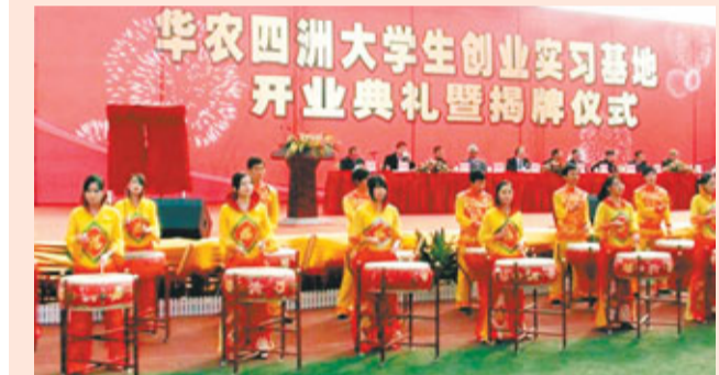
華農四洲大學生創業實習基地正式開業揭牌，各主禮嘉賓在主席台上就座，欣賞鑼鼓隊表演助興。

日前，「華農四洲大學生創業實習基地」在廣州市華南農業大學燕山運動場舉行隆重的開業典禮暨揭牌儀式。全國政協副主席羅富和發來賀信，對大學生創業實習基地的建立表示熱烈祝賀。全國政協常委、香港四洲集團主席戴德豐博士，廣東省政協副主席溫思美，廣東省委統戰部副部長趙健和華南農業大學校長陳曉陽共同為該基地揭牌。廣東省政協、廣東省委統戰部、廣東省教育廳、華南農業大學、華南理工大學、暨南大學、江西師範大學等機構的嘉賓及四千多名大學生參加了揭牌儀式。香港著名歌星、四洲集團產品代言人張敬軒還舉行了助興演唱。