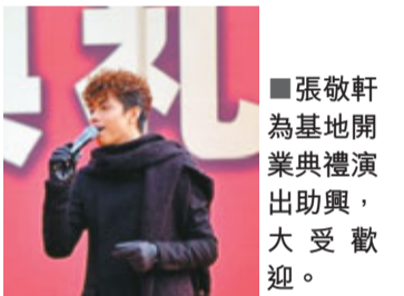
張敬軒為基地開業典禮演出助興，大受歡迎。

香港著名歌星、四洲集團產品代言人張敬軒也出席了開業揭牌儀式，並為現場大學生進行了表演，贏得現場掌聲不斷，更令大學生們雀躍不已，現場氣氛熱烈。張敬軒勉勵大學生裝備自己，使自己活得更精彩。