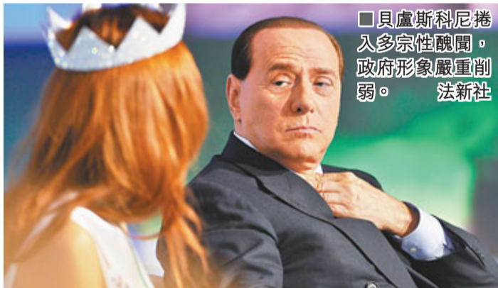
貝盧斯科尼捲入多宗性醜聞，政府形象嚴重削弱。

文件披露一些電話竊聽內容，包括老貝舉行淫亂派對時的露骨細節，如客人會穿護士或女警制服。另外，在馬魯與前男友母親的電話談話中，馬魯聲稱，她要求老貝支付500萬歐元作為賠償聲譽受