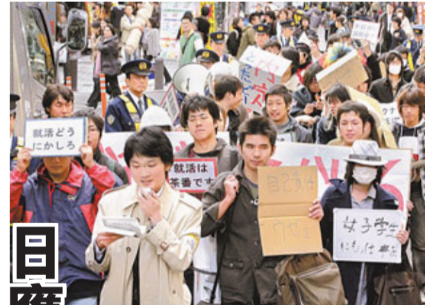
東京學生去年示威，促政府協助就業。

日本厚生勞動省及文部科學省昨日表示，將於今年春季畢業的大學生中，68.8%人已覓得工作，較去年下跌4.3個百分點，是自1996年有紀錄以來的新低，意味有近1/3大學畢業生工作仍未有著落。