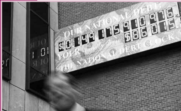
2008年10月，美債首次突破10萬億美元(約77.8萬億港元)。