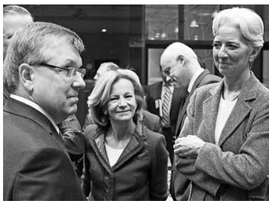
(左起)匈牙利、西班牙和法國的財長，在布魯塞爾歐盟財長會議上傾談。

歐元區財長前日討論把歐洲金融穩定機制(EFSF)的貸款能力，從2,500億歐元(約2.6萬億港元)提升至4,400億歐元(約4.6萬億港元)，協助財困成員國對抗主權債務危機，但會議未達成協議，將於未來數周繼續討論。EFSF昨表示，已委托匯控、花旗和法興，發行最多50億歐元(約522億港元)債券，為救助愛爾蘭融資。