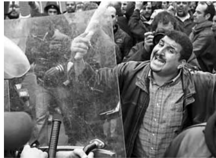
示威者拿麵包與防暴警察對峙。