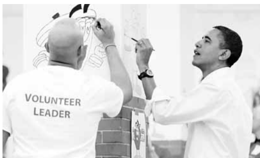
奧巴馬在前日的「馬丁路德金日」到一間中學校為壁畫上色。