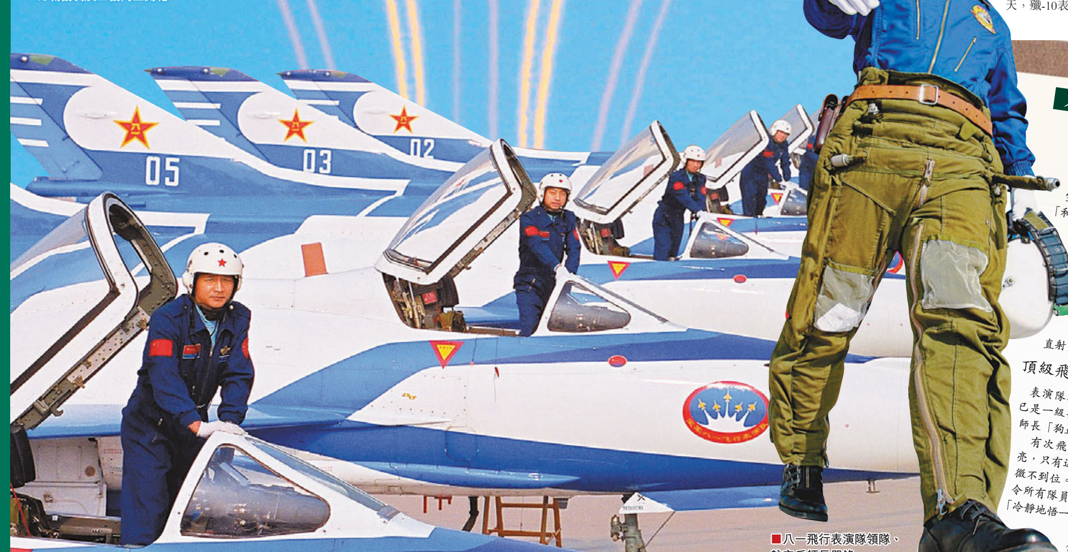
■八一飛行表演隊整裝待發。