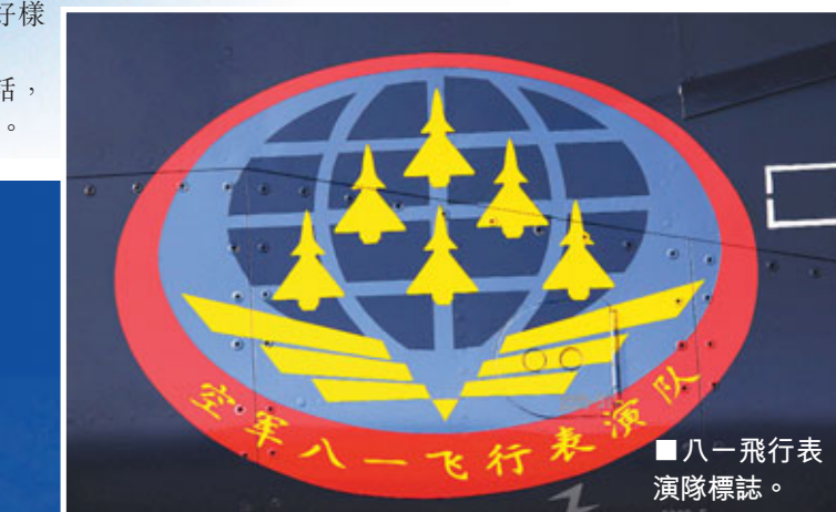
■八一飛行表演隊隊徽。