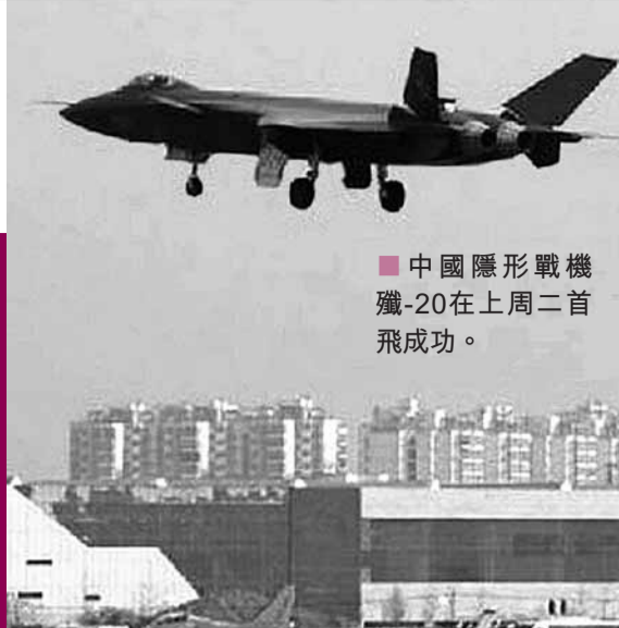
中國隱形戰機殲-20在上周二首飛成功。