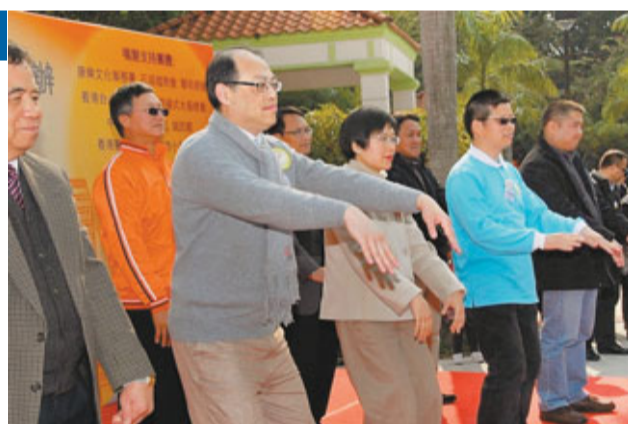
許曉暉與林大輝及在場市民耍「18式太極氣功操」。

致力開展地區工作的「社區18」，昨日在水花園舉行「關愛社區共融嘉年華」作為新年頭炮活動，民政事務副局長許曉暉現身撐場，並與召集人、立法會議員林大輝及在場市民耍「18式太極氣功操」。