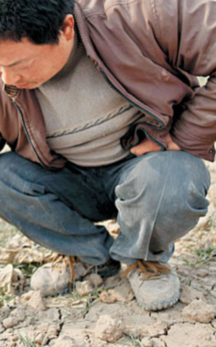
安徽亳州一名村民在展示乾枯的麥苗。

此外,美國農業部近日下調對全球主要農作物產量的預期,並提高對部分需求的預期。在業內人士看來,這意味著全球主糧供應格局趨緊的態勢逐漸明朗。而事實上,持續走高的糧價已引發了爆發新一輪全球糧食危機的擔憂,這有可能加劇全球通脹壓力。20國集團、世界銀行等多個國際組織,目前已開始介入糧食問題。