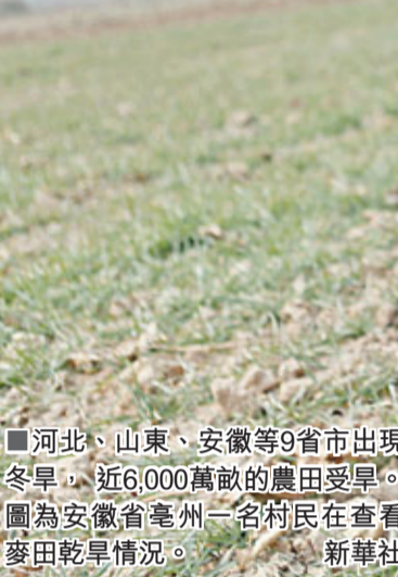
河北、山東、安徽等9省市出現冬旱,近6,000萬畝的農田受旱。圖為安徽省亳州市一名村民在查看麥田旱情。

不過,劉清力對中國國內情況持相對樂觀態度。他分析認為,中國小麥已連續7年增產,庫存量較為充沛,即使今年減產,供需面亦不會受太大影響。而受國際糧食市場影響,中國國內糧食在價格方面將有所體現,但漲幅及波動程度較國際市場相對較小。