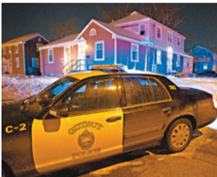
■警車上周四晚在案發寓所外駐守。