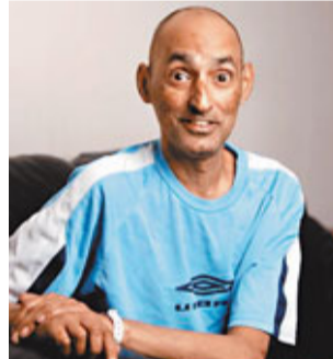
■阿倫感激醫生一直堅持,令他奇蹟生存。