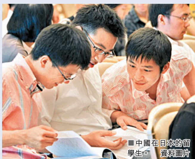
中國在日本的留學生。資料圖片

香港文匯報訊 據《日本新華僑報》報道，日前，該報連續報道了日本青森大學中國留學生因違反學校學籍管理而被勸退的相關事件。近日，該報從日本青森大學獲悉，在該校中國留學生群體中，違反學校相關學籍管理規定的中國留學生已經達到140人。