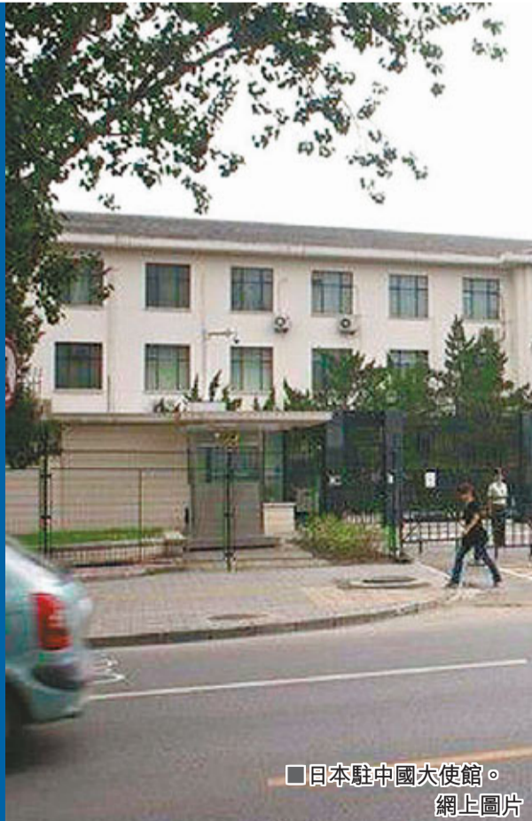
日本駐中國大使館。

香港文匯報訊 據共同社14日電 記者14日從日本駐中國大使館獲悉，北京市內的日本大使館新聞文化中心有兩塊玻璃被砸碎。大使館已就此向中國外交部表示了「遺憾」。