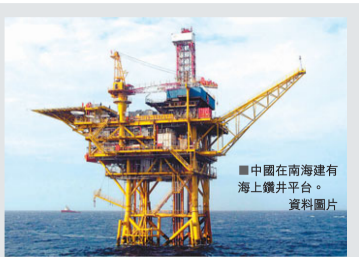
中國在南海建有海上鑽井平台。資料圖片

主要報道朝鮮消息的網絡媒體Daily NK最近援引朝鮮內部消息人士的話報道說：「朝鮮和中國在去年12月簽署了一項投資協議，其內容為在羅先港增建3座碼頭，在吉林省圖河與羅先特別市之間建立高速公路和鐵路。居民們爭相報名去這些施工現場工作。」據悉，隨着朝鮮開展招商引資工作，前往羅先的中國人不斷增加。