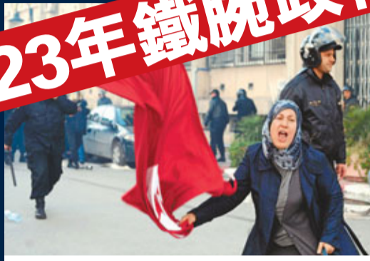
揮舞國旗慶祝。