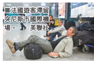
法國遊客滯留突尼斯市國際機場。美聯社

突尼斯局勢惡化，數千名歐洲旅客緊急撤離，3,800名德國、英國及愛爾蘭人及時乘旅行社包機回國，但仍有很多人未能趕在緊急狀態下令領空關閉前離開，滯留機場。在北部地中海勝地，遊客同樣遇上騷亂，有英國遊客親眼見到一位女子被殺：「她跑到銀行提款，警察以為她帶著炸彈，二話不說就朝她頭部開槍。」英、法、德、荷、葡及波蘭等歐洲國家，均已對突尼斯發出旅遊警告。