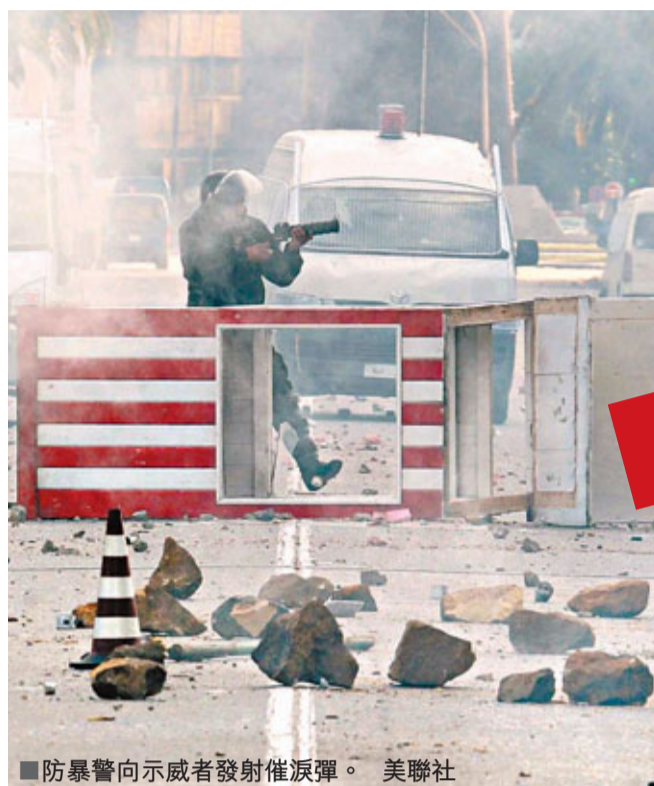
防暴警向示威者發射催淚彈。

北非國家突尼斯暴力衝突持續近一個月，前日出現突破性發展。74歲總統本·阿里前晚逃亡到沙特阿拉伯，標誌阿里23年的鐵腕強人統治結束，也是首次有阿拉伯強人被民眾拉下台。由於多個阿拉伯國家近日相繼出現示威，有分析認為突尼斯的這場「茉莉花革命」或會引發骨牌效應，衝擊阿拉伯世界的鐵腕政權。