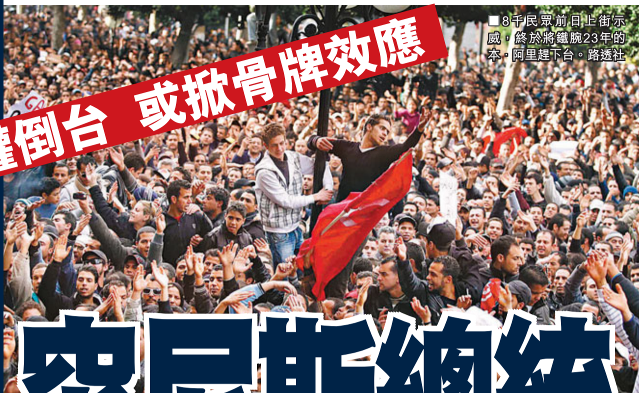
8千民眾日前上街示威，終於將鐵腕23年的本·阿里趕下台。