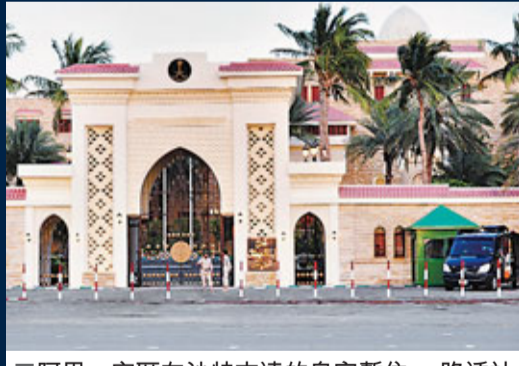
阿里一家匿在沙特吉達的皇宮暫住。