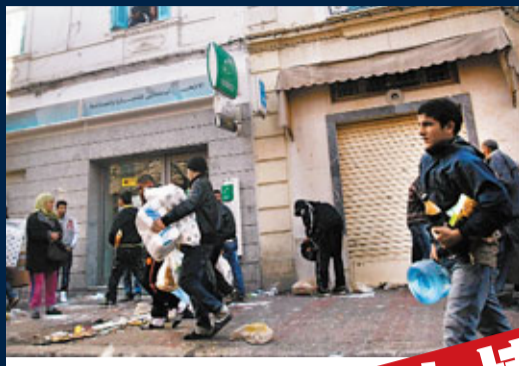
居民搶掠被毀的商店。