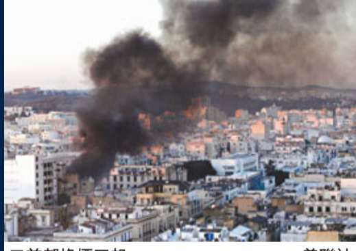
首都烽煙四起。