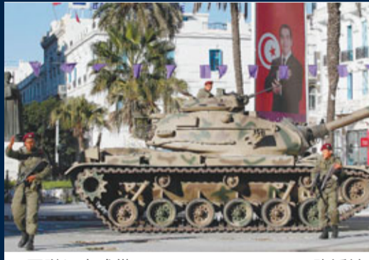
軍隊坦克戒備。