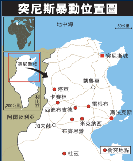
突尼斯暴動位置圖