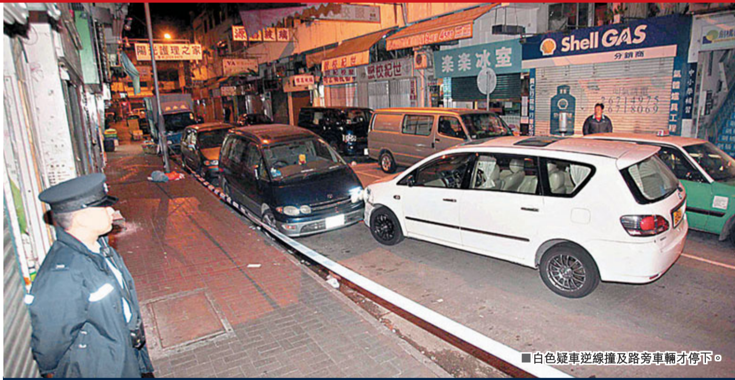
白色疑車逆線撞及路旁車輛才停下。