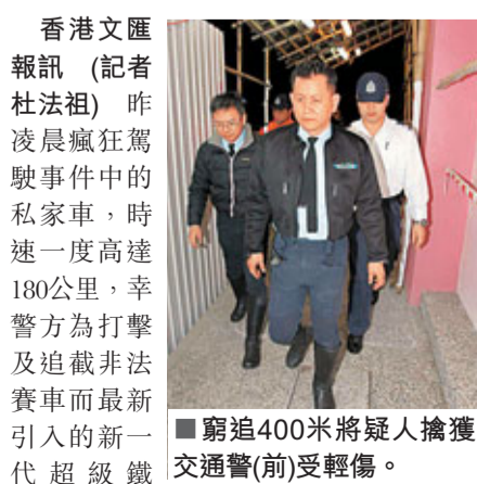
窮追400米將疑人擒獲 交通警(前)受傷。

香港文匯報訊 (記者 杜法祖) 昨凌晨瘋狂駕駛事件中的私家車，時速一度高達180公里，幸警方為打擊及追截非法賽車而最新引入的新一代超級鐵馬，時速可高達240公里，在追逐中一直緊隨，沒有讓疑車逃脫。上月11日，該批超級鐵馬已於荃錦公路一次反非法賽車行