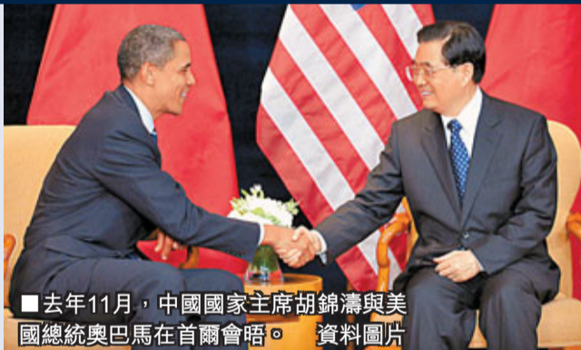
去年11月，中國國家主席胡錦濤與美國總統奧巴馬在首領會晤。資料圖片

多尼隆指出，奧巴馬政府從一開始就致力於與中國建立積極、合作、全面的關係，美方非常看重這種關係，不僅