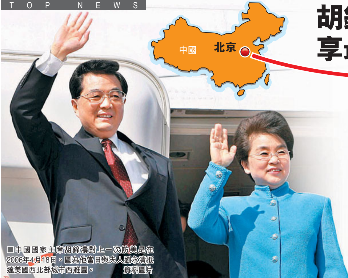
中國國家主席胡錦濤對上一次訪美是在2006年4月18日。圖為他當日與夫人劉永清抵達美國西北部城市西雅圖。資料圖片