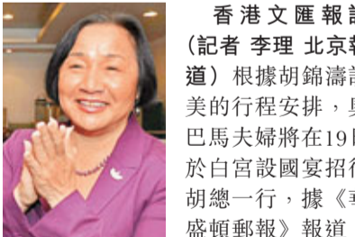
加州奧克蘭市長關麗珍(見圖)是第一個目前已知的獲邀者。

關麗珍1月3日宣誓成為奧克蘭158年歷史上、美國大城市中第一位女性華裔(亞裔)市長，迅速成為媒體熱點人物。關麗珍向記者證實她已獲得邀請，出席19日在白宮舉行的歡迎胡主席的晚宴，她對此表示非常榮幸。