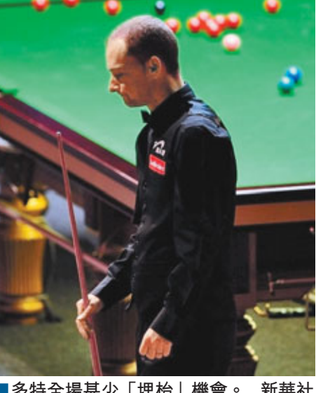
多特全場甚少「埋枱」機會。

軍。」早前表示不看好丁俊暉的名將戴維斯亦坦承之前的預言有些武斷：「丁俊暉在這樣的狀態下很具有奪冠的實力，甚至是不容阻擋的。他現在的水平要比他在07年輸給奧蘇利雲時強得多，如果我們現在去看他17歲時的比賽錄像，就會發現丁俊暉在各方面都勝過從前。」