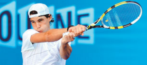
拿度近日積極備戰。

界排名96位的丹尼爾，但其後2圈隨即遇上「黑馬」盧比斯及發球機器伊士拿，第4輪更大有機會與15號種子的克羅地亞球手施歷碰頭，4強亦再遇上梅利或蘇達寧。而衛冕冠軍費達拿亦將向5屆澳網冠軍進發，其籤運則較為順利，僅於8強或與前美網冠軍盧迪克碰頭，4強或與祖高域交手。 面對外界對拿度將成為42年來首位球手連奪四大