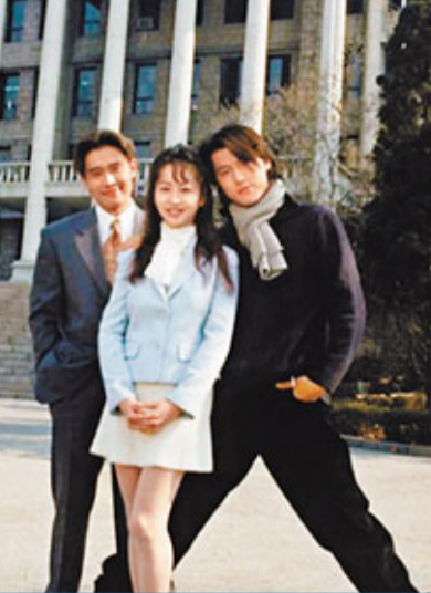
(左起)李秉憲、金秀智和鄭雨盛年輕時的樣子靑澀。

前日韓國某網站以「鄭雨盛魅力照」為題，公開了一張鄭雨盛和李秉憲的合照，引起網民熱話。該照片攝於1995年，當時兩人一起出演了SBS電視台的韓劇《車神傳說》，並和劇中女主角金秀智合影。在照片中，鄭雨盛考慮到自己與其他兩人的身高有差距，專程擱開雙腿，將自己的身高調整到與金秀智和李秉憲一樣的高度。不少網友力讚鄭雨盛細心周到，亦有網友表示李秉憲安靜的站在旁邊，好像飽受屈辱，不應該把他拍進照片中。