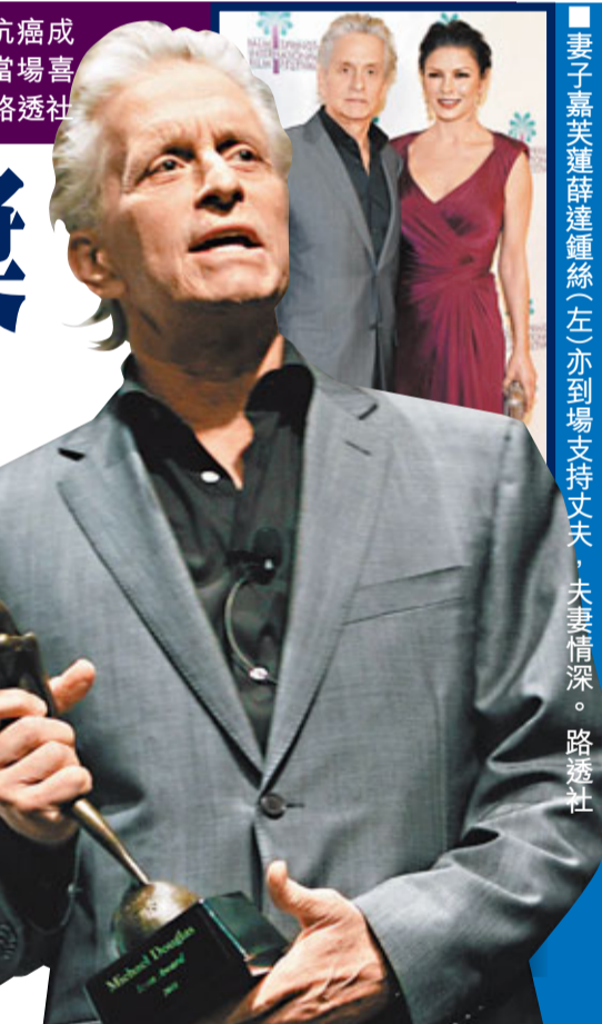
米高德格拉斯抗癌成功，又能獲獎，當場喜上眉梢。