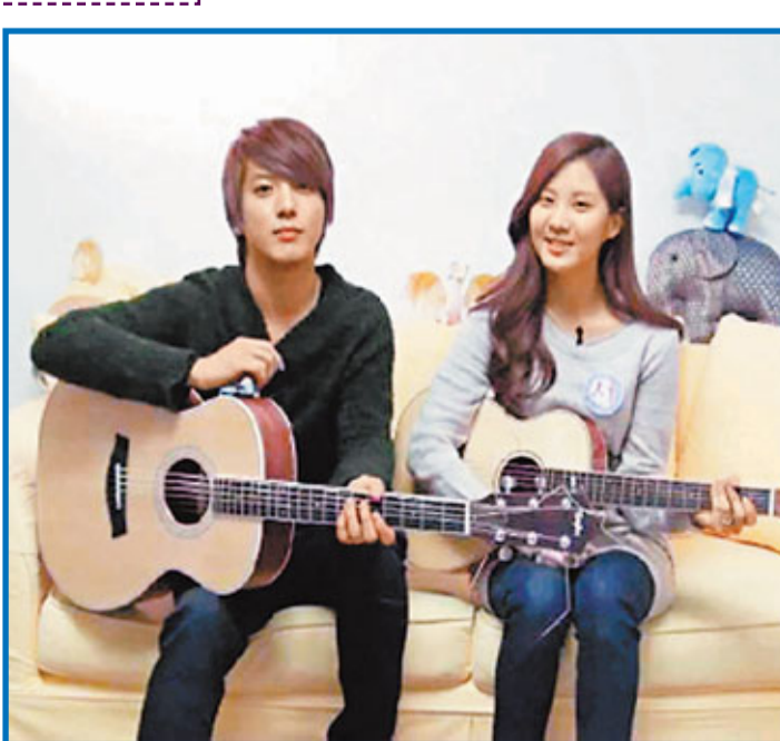
(左起)鄭容和與徐賢在節目中以結他演唱《平語歌》，引來熱烈迴響。

韓國樂隊CNBlue隊長鄭容和昨日凌晨在網上公開最新單曲《為第一次愛的人》，慶祝樂隊出道一周年紀念，該曲講述戀人初次相見時的生疏，及想要逐漸親近的心情，可愛的歌詞和朗朗上口的旋律，令該曲不足10小時已佔據各大音源網站的排行榜首位。