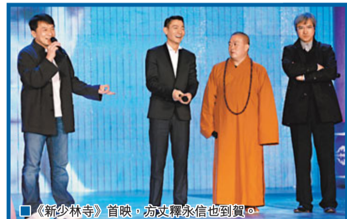
《新少林寺》首映，方丈釋永信也到賀。