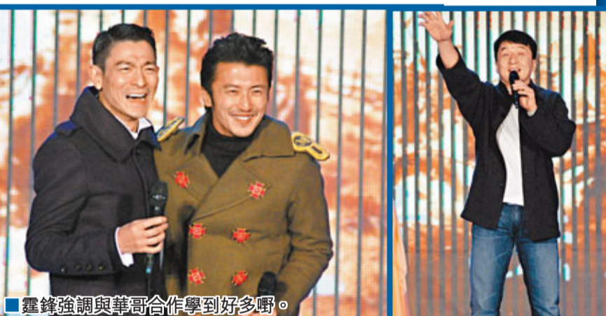
霆鋒強調與華哥合作學到好多嘢。