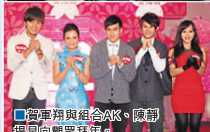
賀軍翔與組合AK、陳靜提早向觀眾拜年。