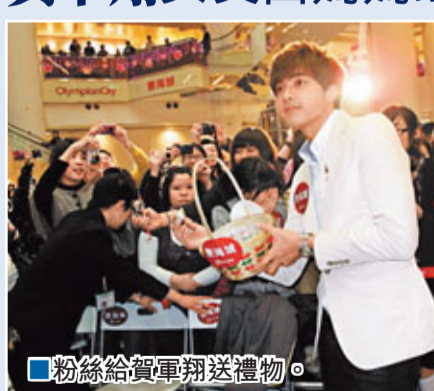
粉絲給賀軍翔送禮物。